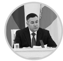
ИГОРЬ РУДЕНЯ Губернатор Тверской области

Ярким примером эффективности госпрограммы Тверской области «Молодежь Верхневолжья», направленной на решение жилищных вопросов молодых семей, является то, что только в течение прошлого года регион оказал помощь в приобретении жилья 134 молодым семьям, в их числе – многодетные и семьи участников СВО.