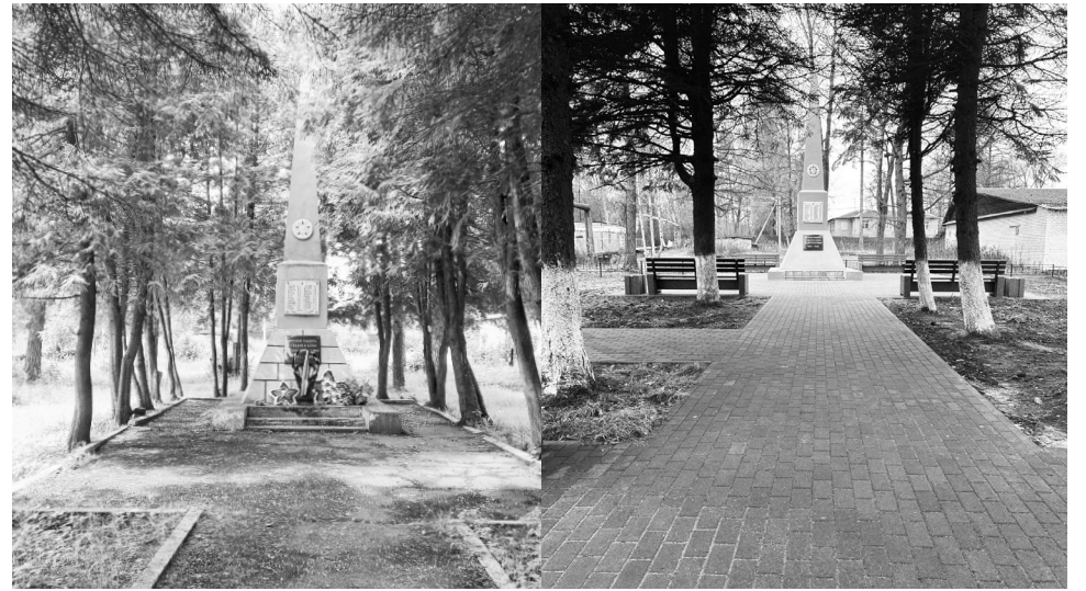
Памятник в п. Новозавидовский до и после реконструкции

Запланирована и масштабная реконструкция воинского мемориала в селе Селихово, сейчас специалисты отдела молодежной политики администрации Конаковского округа готовят необходимый пакет документов, а сами работы планируют начать в весенне-летний пе-