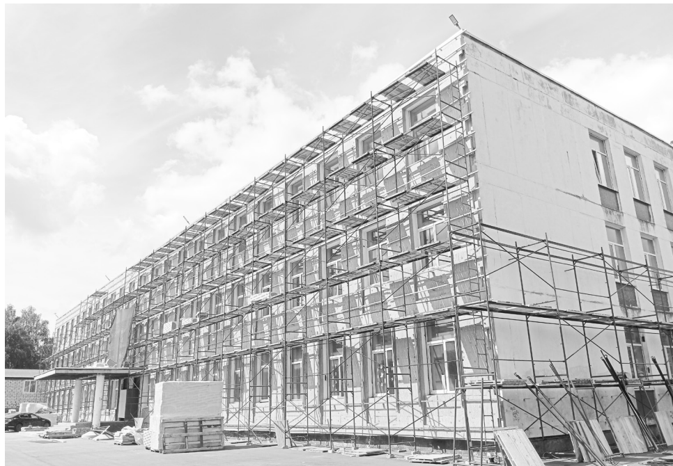
Капитальный ремонт СОШ №3 г.Конаково

В 2026 году в бюджете Конаковского муниципального округа заложены значительные средства на выполнения ремонтно-строительных работ по всем направлениям в рамках полномочий местной власти: в учреждениях образования и культуры, улично-дорожной сети, объектах ЖКХ, благоустройству. Хорошим подспорьем является участие жителей округа в проектах по программе поддержки местных инициатив (ПМИ).