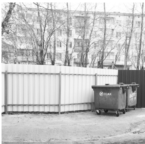
Контейнерная площадка г. Конаково, ул. Энергетиков 28

• выполнение работ по благоустройству площадок накопления ТКО (70 контейнерных площадок по всему округу).