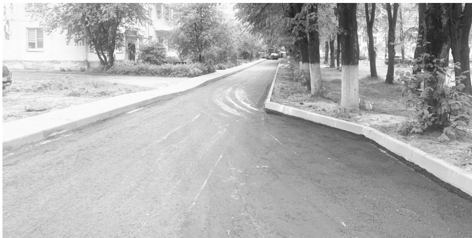
Ремонт дорожной сети в г. Конаково продолжается

• выполнение работ по благоустройству площадок накопления ТКО (70 контейнерных площадок по всему округу).