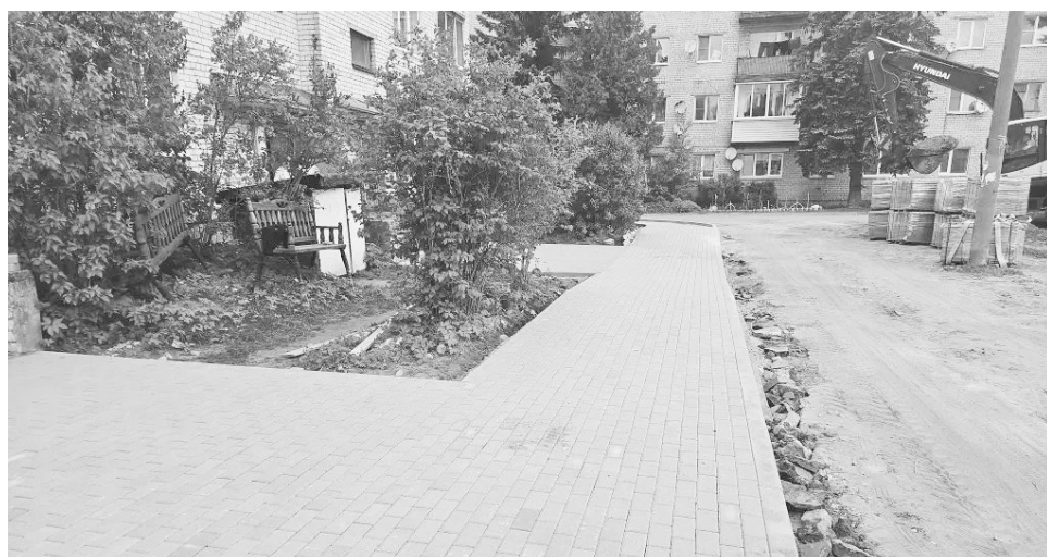
Обустройство дороги с тротуарами в п. Новозавидовский.