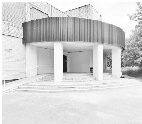
Ремонт входной группы Центра внешкольной работы г.Конаково