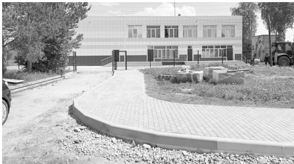
Пешеходная дорожка и подъезды к СОШ д. Ручьи