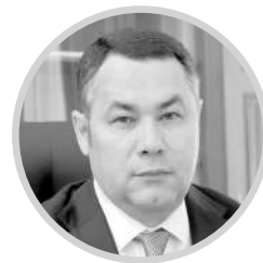
ИГОРЬ РУДЕНЯ Губернатор Тверской области

Рост самозанятых в Тверской области стал одним из самых высоких в ЦФО. По сравнению с 2020 годом эта категория предпринимателей тверичан увеличилась в 9,5 раза. Причина — в особой поддержке самозанятых в Верхневолжье. К примеру, региональный Фонд содействия предпринимательству предоставляет льготные займы по программе «Самоза-