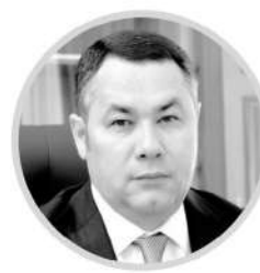
ИГОРЬ РУДЕНЯ Губернатор Тверской области

Обязательным условием при строительстве многоквартирных домов является обеспечение новых микрорайонов и жилых комплексов всей необходимой социальной, транспортной и инженерной инфраструктурой