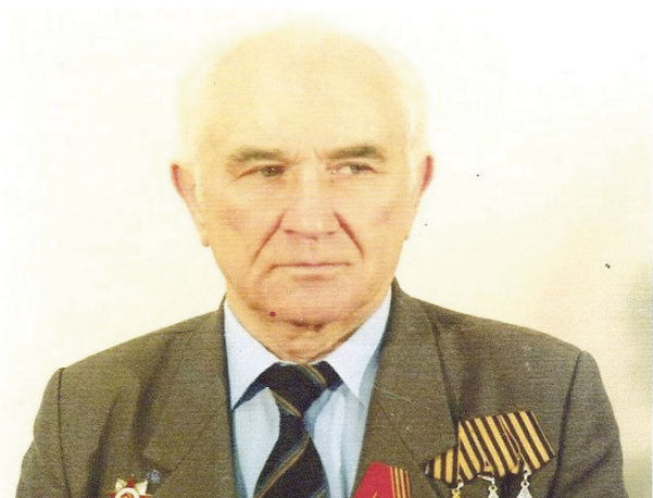
Почтили память ветерана Великой Отечественной войны ..... 10