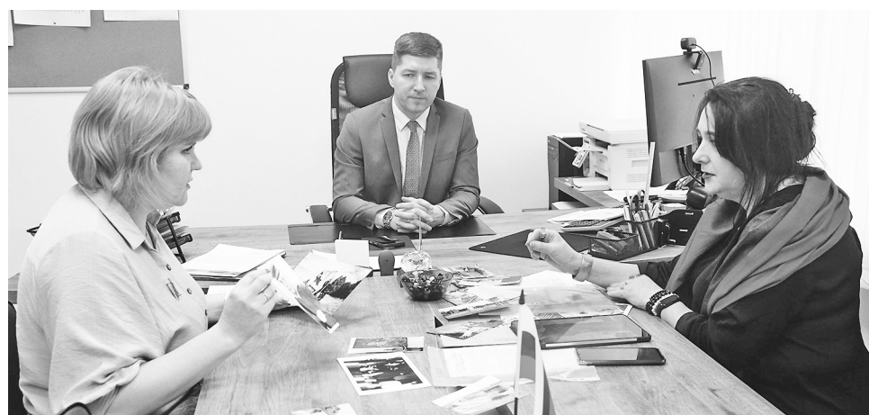
Подготовлено пресс-службой администрации Конаковского муниципального округа