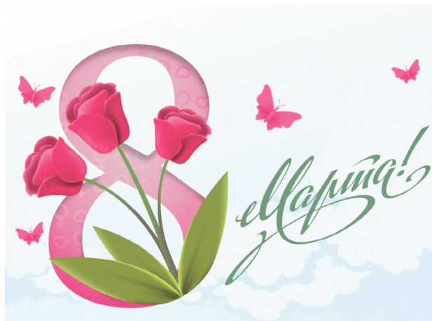
Поздравляем с Международным женским днем ..... 4