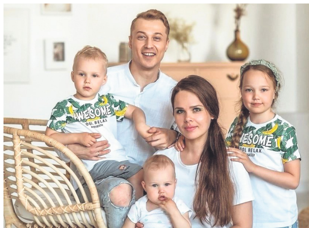
Тверская губерния: Главное в государственной политике – семья ..... 2