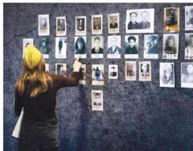
«Бессмертный полк» и «Стена памяти» в Тверской области ..... 2

В Конаковском округе в эти дни проходят десятки тематических мероприятий, которые направлены на сохранение памяти о Великой Победе, о Великом Подвиге советского народа. 6 мая на центральной площади прошел яркий парад малышковых войск. Традиционный митинг 7 мая состоялся у мемориала сержанту Вячеславу Васильковскому в окрестностях деревни Рябинки. Мероприятие объединило жителей Конаковского округа всех возрастов, которые с благодарностью каждый год чтят память великих героев. Подробнее читайте на странице 8.