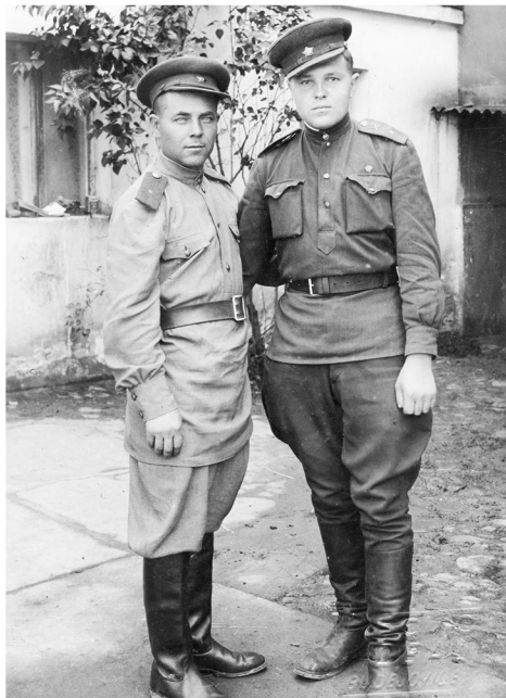
Чешские Будиевицы, 31 августа 1945 г.