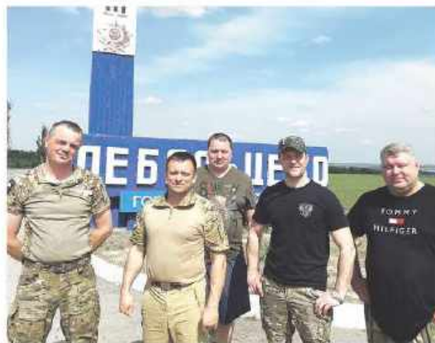
Бесконечное чувство единства фронта и тыла ..... 9