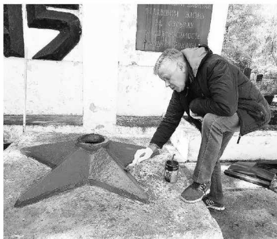
Подготовлено пресс-службой администрации Конаковского муниципального округа