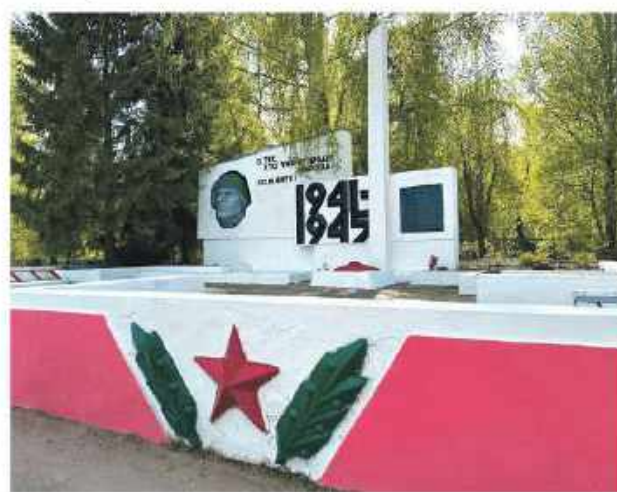
Субботник на Братской могиле воинов Великой Отечественной войны ..... 3