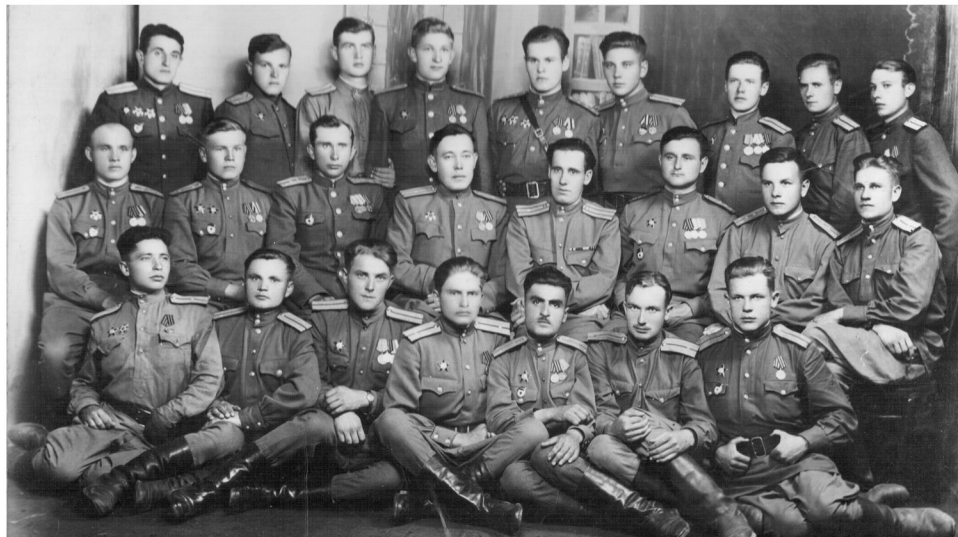
Яссы, 1945-1946 гг.

цы, а некоторые решили поднять руки и сдаться. Несмотря на это, сопротивлялись они здесь крепко. И много наших бойцов сложили свои головы за овладение этим мощным узлом обороны. В смерти наших бойцов виноваты продажные русские души – власовцы. Они сопротивляются и дерутся лучше самых заядлых СС.