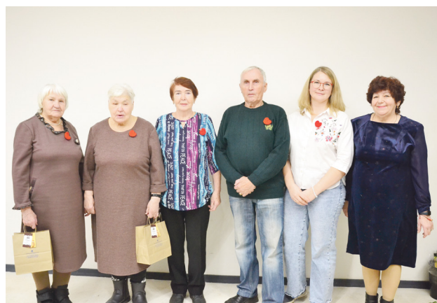
Отметили Международный день инвалида ..... 9