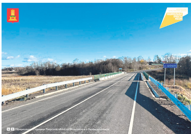
Хорошие дороги Верхневолжья – новые горизонты развития региона ..... 3