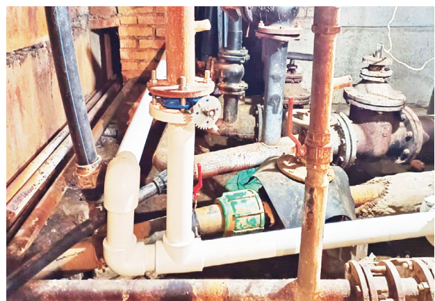
В Новозавидовском восстановлено горячее водоснабжение ..... 2

Такое внимание к этим датам позволяет молодому поколению в полной мере осознать важность сохранения исторической памяти для будущих поколений. Это возможность для всех нас задуматься о цене мира и свободы, которую заплатили наши предки, и которую сейчас платят наши земляки.