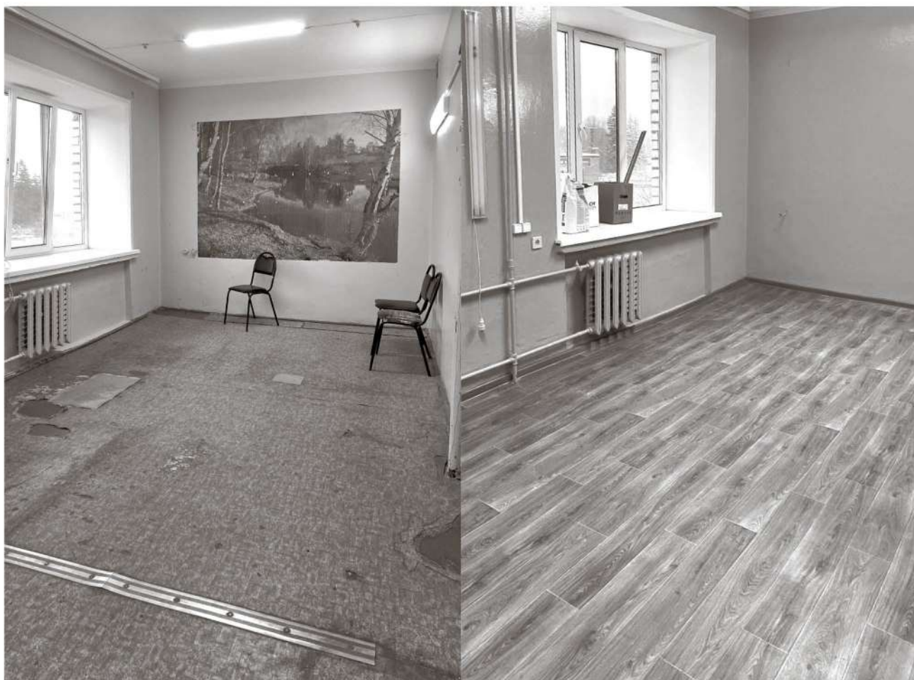
Ремонт офтальмологического кабинета

Беседовала Анна Сабурова.