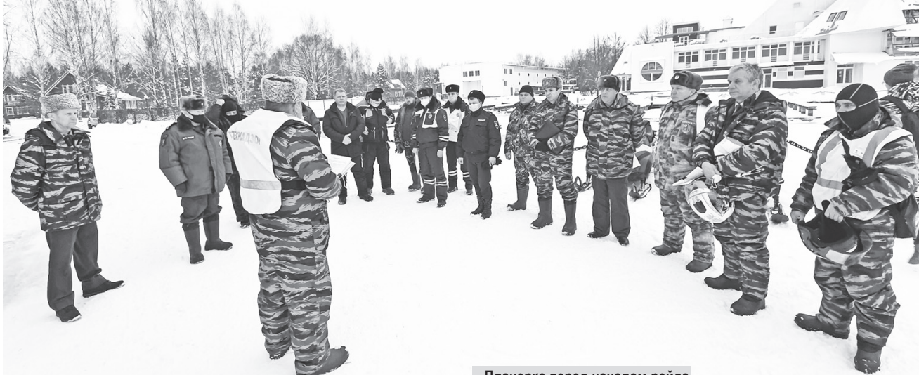
Планерка перед началом рейда