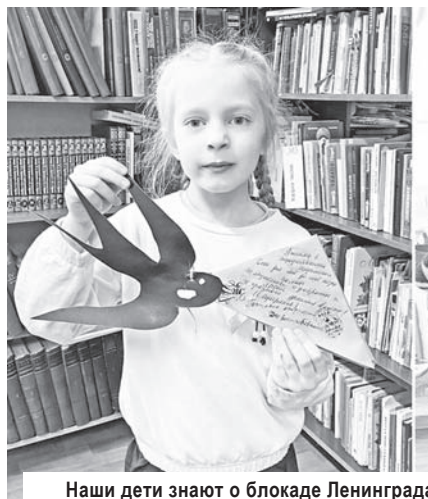
Наши дети знают о блокаде Ленинграда

«Громкое чтение» - следующая страничка встречи. Дети с интересом читывали солдатские письма из книги И.В.