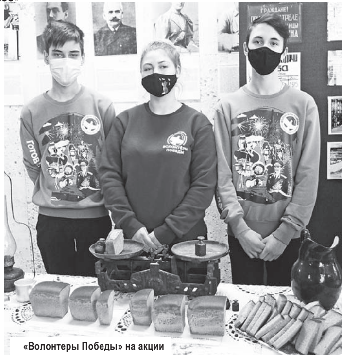
«Волонтеры Победы» на акции