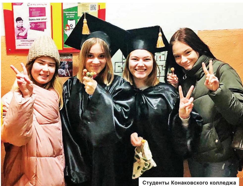
Студенты Конаковского колледжа