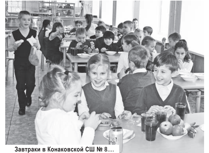
Завтраки в Конаковской СШ № 8....

щих правил безопасности и доброжелательному «домашнему» обслуживанию детей.