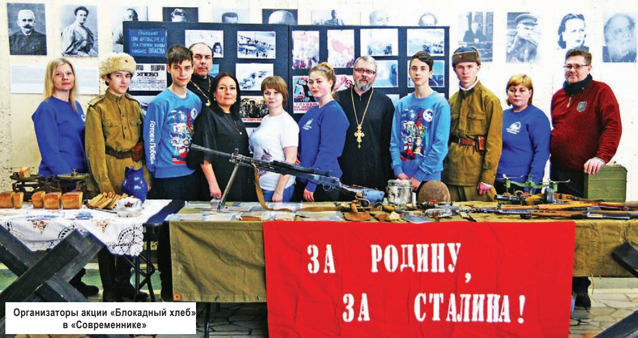
Организаторы акции «Блокадный хлеб» в «Современнике»

В среду вся страна отмечала историческую дату: 77 лет назад, 27 января 1944 года была полностью снята блокада города-героя Ленинграда.