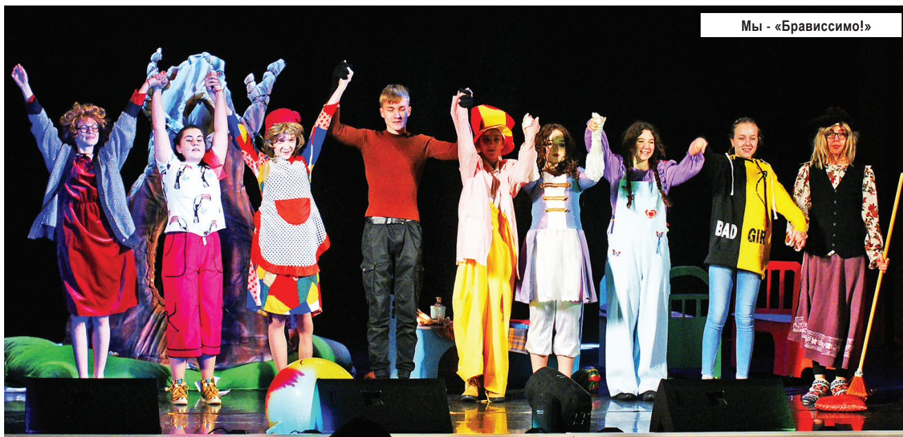
Мы - «Брависсимо!»