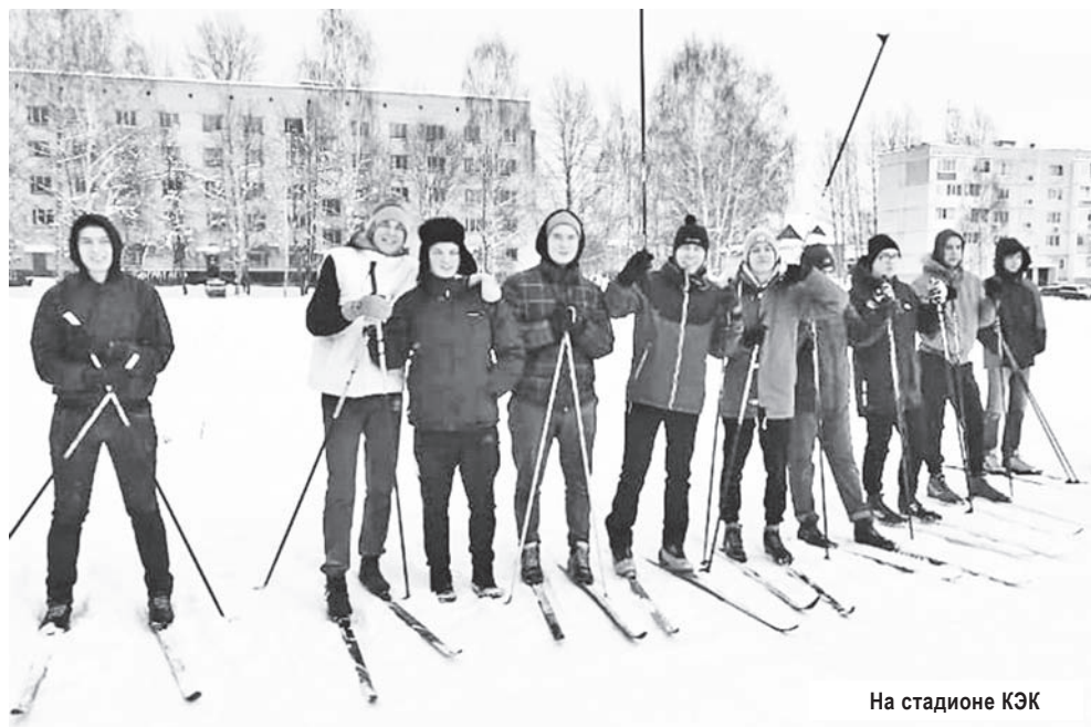
На стадионе КЭК

энергетического колледжа. В честь Дня российского студенчества ребятам продемонстрировали правильную стойку на лыжах, показали различные лыжные ходы, как преодолевать подъемы и как стойки занимать при спусках. Также рассказали, как нужно дышать и что делать, чтобы от прогулки на лыжах получать удовольствие.