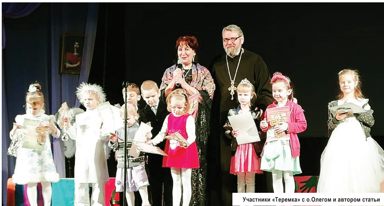
Участники «Теремка» с о.Олегом и автором статьи

Вот уже в третий раз приход храма 40 святых Севастийский мучеников и образцовый детский театр «Теремок» ДК «Современник» в светлые праздники Рождества Христова провели фестиваль-конкурс чтцов «Свет Рождественской звезды». Надо сразу сказать, что в фестивале уча-