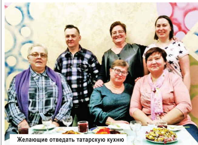
Желающие отведать татарскую кухню

О татарской кухне и ее истории рассказали на очередном заседании «Гурман-встречи» в Конаковской МЦБ.