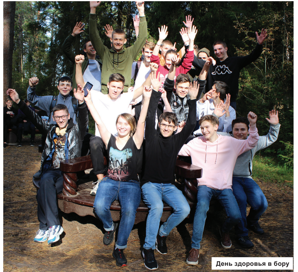
День здоровья в бору