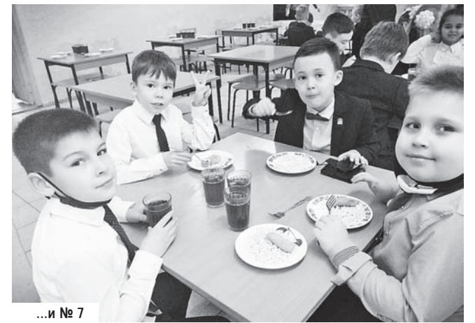
...и № 7