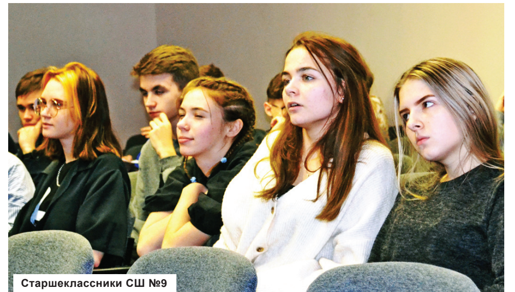
Старшеклассники СШ №9

за болящими и оказывала помощь нуждающимся. По приказу римского императора Александра Севера Татиана