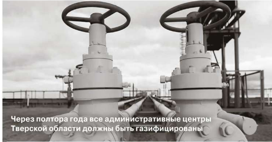
Через полтора года все административные центры Тверской области должны быть газифицированы

Так, в 2020 году Губернатор Тверской области Игорь Руденя и председатель Правления ПАО «Газпром» Алексей Миллер подписали программу развития газоснабжения и газификации региона на 2021–2025 годы с общим объемом финансирования порядка 23,5 млрд рублей (где 15,9 млрд рублей – инвестиции ком-