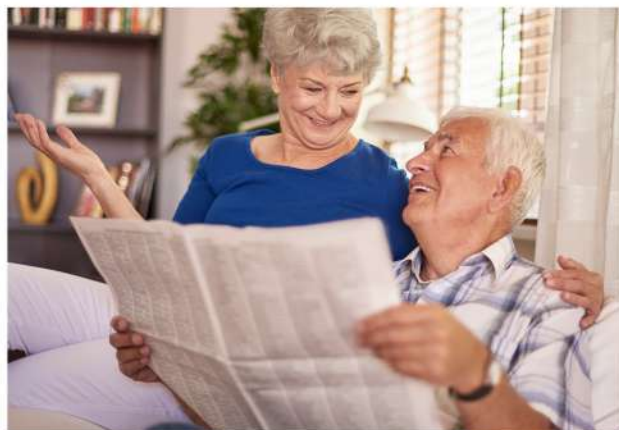
Стартовала благотворительная акция «Добрая подписка» ..... 7