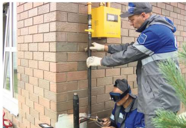
Обеспечить стопроцентную газификацию до 2026 года ..... 2

19 апреля в Комсомольском сквере 56 ребят Конаковского округа принесли присягу на верность Отечеству и всему юнармейскому братству ..... стр. 9