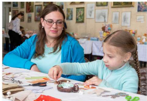
Сотрудники ДК «Современник» организовали семейный праздник ..... 8