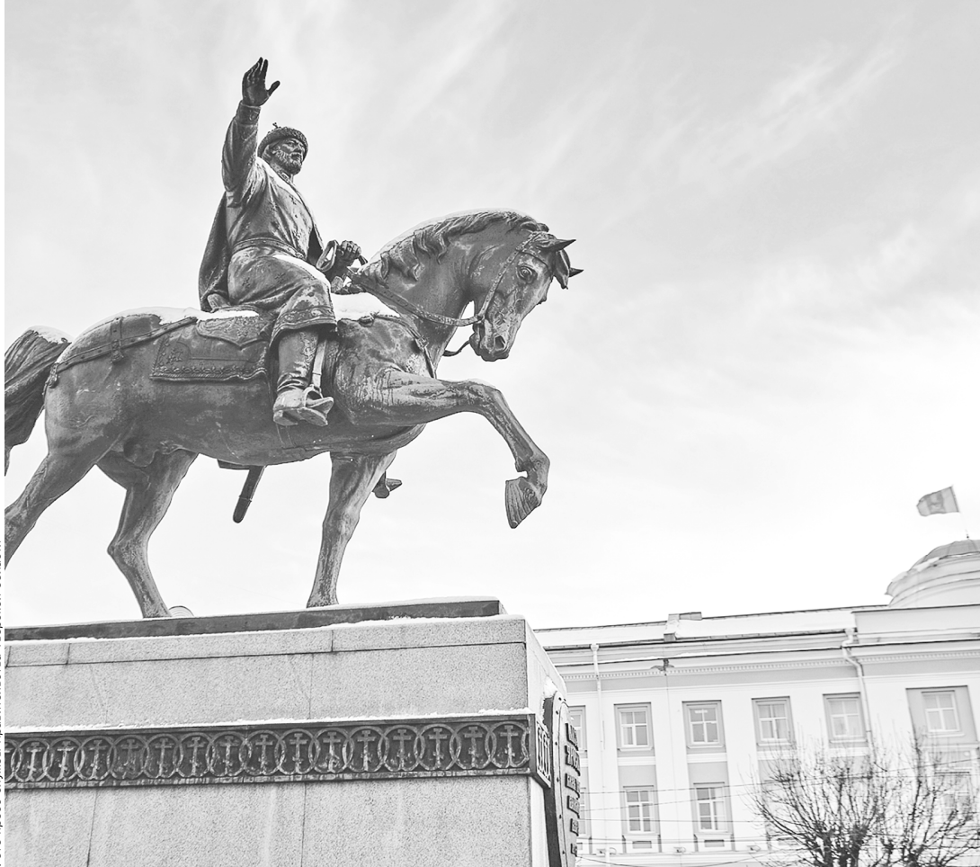
Губернатор Игорь Руденя поставил задачи по сохранению и государственной охране объектов культурного наследия в Тверской области