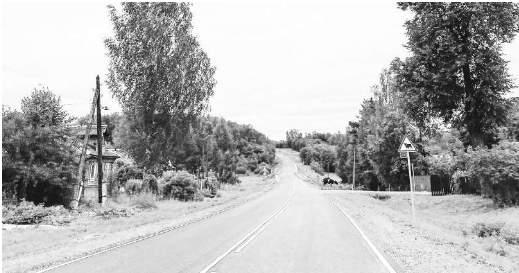
В Тверской области, по поручению губернатора Игоря Рудени, на год раньше предусмотренного срока отремонтируют дорогу от М-10, проходящую по Калининскому и Старицкому округам

Трасса является туристическим маршрутом в город Старица, к древним храмам и комплексу Свято-Успенского монастыря. Дорога проходит параллельно федеральной трассе Р-132 «Золотое кольцо» на участке от М-10 до Старицы.