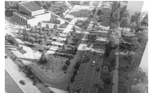
Парковая зона по ул. Венецианова в Удомле

«Комфортная городская среда – лицо муниципальных образований, Тверской области. От того, насколько современными, удобными и комфортными будут наши города и поселки, зависит привлекательность региона для молодежи, развитие экономики и туризма, улучшение демографической ситуации», – уверен Игорь Руденя.