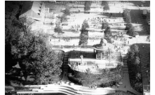
Проект площади 9 Января в Торжке

Всероссийский конкурс лучших проектов создания комфортной городской среды в малых городах и исторических поселениях был организован в 2018 году по поручению Президента Российской Федерации Владимира Путина.