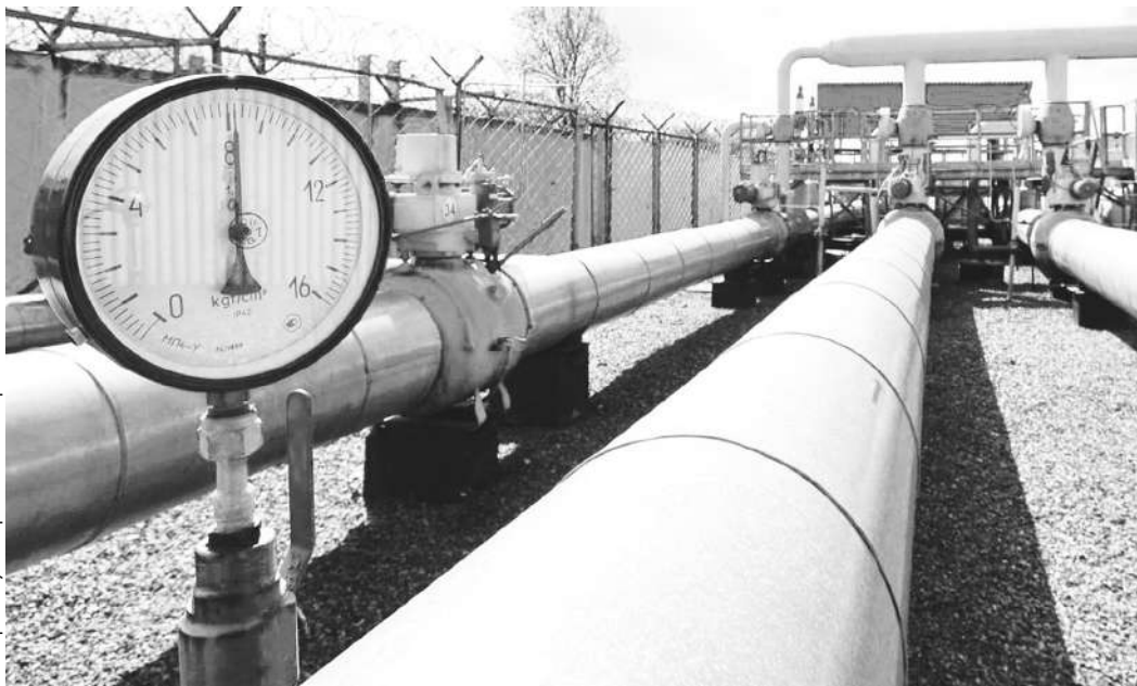
В Тверской области завершено строительство двух газопроводов в Сонковском и Лихославльском округах

2022 год стал новым этапом в процессе газификации Тверской области. Впервые за последние годы газ пришел сразу в три ранее не газифицированных муниципалитета – Жарковский, Краснохолмский и Молоковский округа. До 2026 года планируется газификация всех ранее не газифицированных муниципалитетов северо-востока и юго-запада Тверской области.