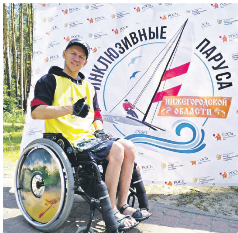
Подготовила Татьяна Крыльцова.

Команда КРОО ВОИ активно участвует в парусных мероприятиях самых разных уровней – от региональных до всероссийских. Они не только проявляют энтузиазм и знания в этой области, но и готовы поделиться