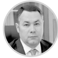
ИГОРЬ РУДЕНЯ Губернатор Тверской области

Как в Тверской области развивают и укрепляют сельское хозяйство, и почему это флагман экономики региона