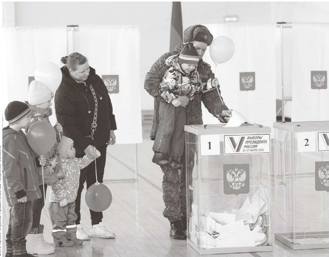
Активное участие в голосовании за Президента России приняли многодетные семьи Верхневолжья