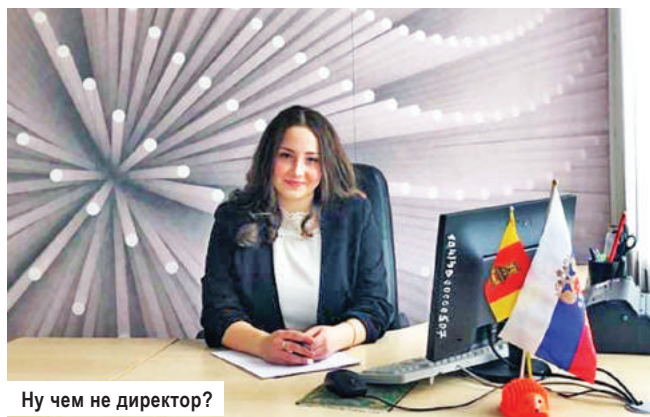
Ну чем не директор?

Одно из важнейших направлений работы школы – профориентация обучающихся. В рамках этого направления в средней школе № 7 г. Конаково прошёл любимый всеми День самоуправления.