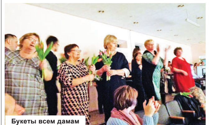
Букеты всем дамам

Под таким романтичным названием прошёл в Юрьево-Девичьевском досуговом центре праздничный концерт, посвящённый Международному женскому дню 8 Марта. По доброй традиции на сцене в этот день выступают одни мужчины. Предпринимателя, учителя, рабочего и главу поселения объединило одно – любовь к хорошей музыке и, конечно же, к женщинам.