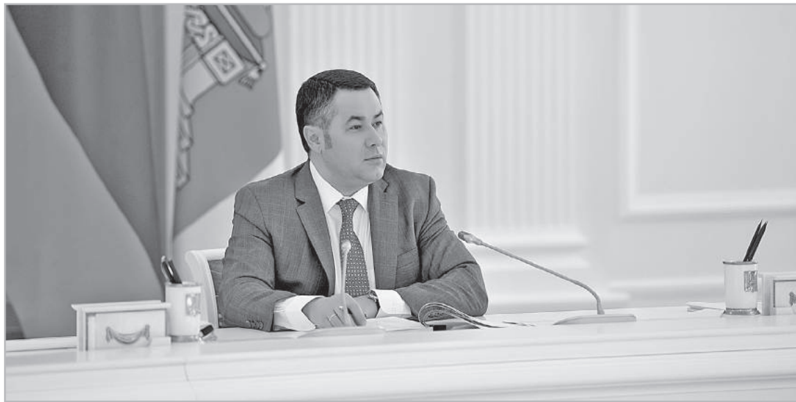
Игорь Руденя занял пост губернатора Тверской области в 2016 году

Разумеется, насадившие на «дойную корову» в виде тверского ЖКХ коммерсанты не желали сдаваться просто, а потому эпопея длилась еще некоторое время – со скандалами и громкими судебными процессами. Однако уже вскоре областной центр забыл о шантаже с выколачиванием невесты откуда взявшихся долгов и холодными батареями. Финансовый поток развернулся в сторону городского бюджета, а сомнительные фирмы вынуждены были уйти со сцены. Конечно же, ветхие коммуникации, оставленные городу предыдущими собственниками, невозможно было восстановить на раз, будто по мановению волшебной палочки. Но главное – заработал четкий прозрачный механизм, когда жители оплачивают квитанции, а деньги идут как раз на содер-