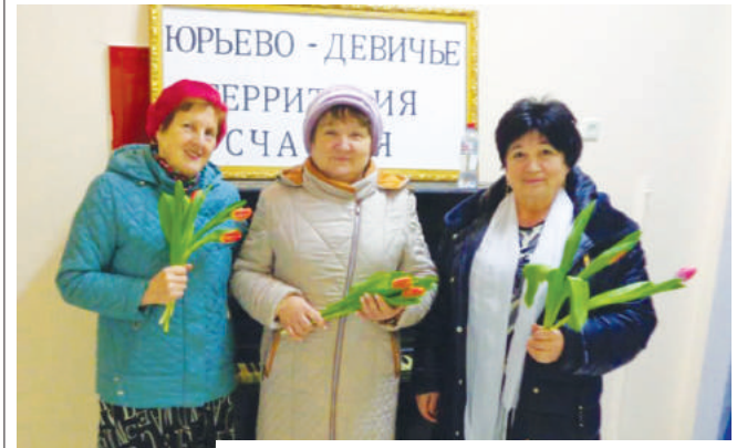
Юрьево-Девичье - территория счастья