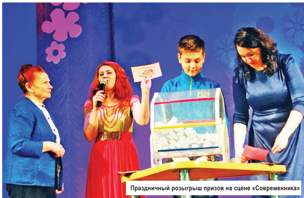
Праздничный розыгрыш призов на сцене «Современника»

В концертной программе приняли участие хореогра-