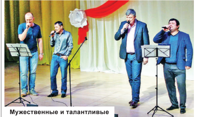
Мужественные и талантливые