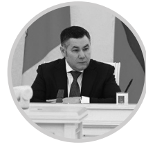
ИГОРЬ РУДЕНЯ Губернатор Тверской области

В Верхневолжье будут действовать системы мониторинга обстановки в лесах: наземное патрулирование, спутниковый и авиационный мониторинг (в том числе с помощью беспилотных авиасистем), видеонаблюдение посредством установленных на вышках сотовой связи 157 видеокамер. Видеонаблюдением охвачено 98 процентов лесного фонда Тверской области, эта система в Верхневолжье наряду с Московской областью – одна из самых крупных в ЦФО. Мониторинг пожароопасной обстановки будет вестись также на участках торфоразработок и в охотничьих угодьях.