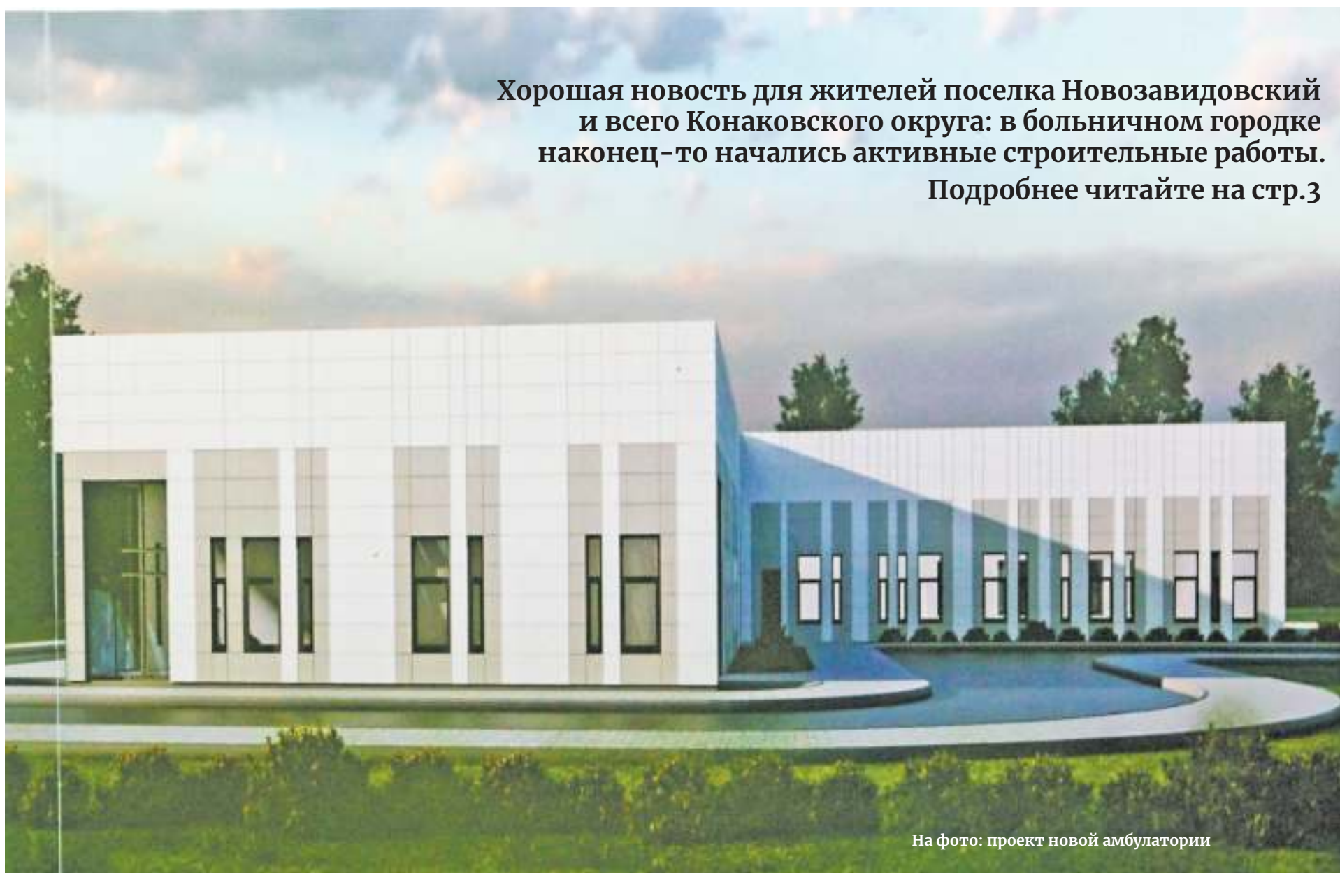
На фото: проект новой амбулатории

Хорошая новость для жителей поселка Новозавидовский и всего Конаковского округа: в больничной городке наконец-то начались активные строительные работы. Подробнее читайте на стр.3