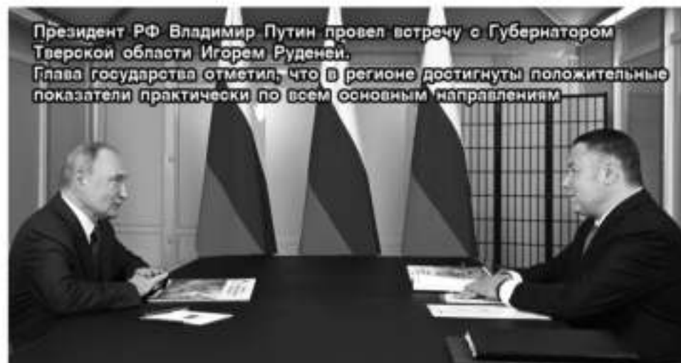
Президент РФ Владимир Путин провел встречу с Губернатором Тверской области Игорем Руденей. Глава государства отметил, что в регионе достигнуты положительные показатели практически по всем основным направлениям

гион, они вряд ли будут возвращаться. А так они учатся, живут и работают здесь, на предприятия проходят практику. И очень интересна реализованная нами с федеральным Правительством программа трудоустройства подростков с компенсацией работодателю заработной платы детям и наставникам. Много предприятий внебюджетной сферы присоединились к этой работе, и школьники получают первые трудовые навыки, первые заработанные деньги.