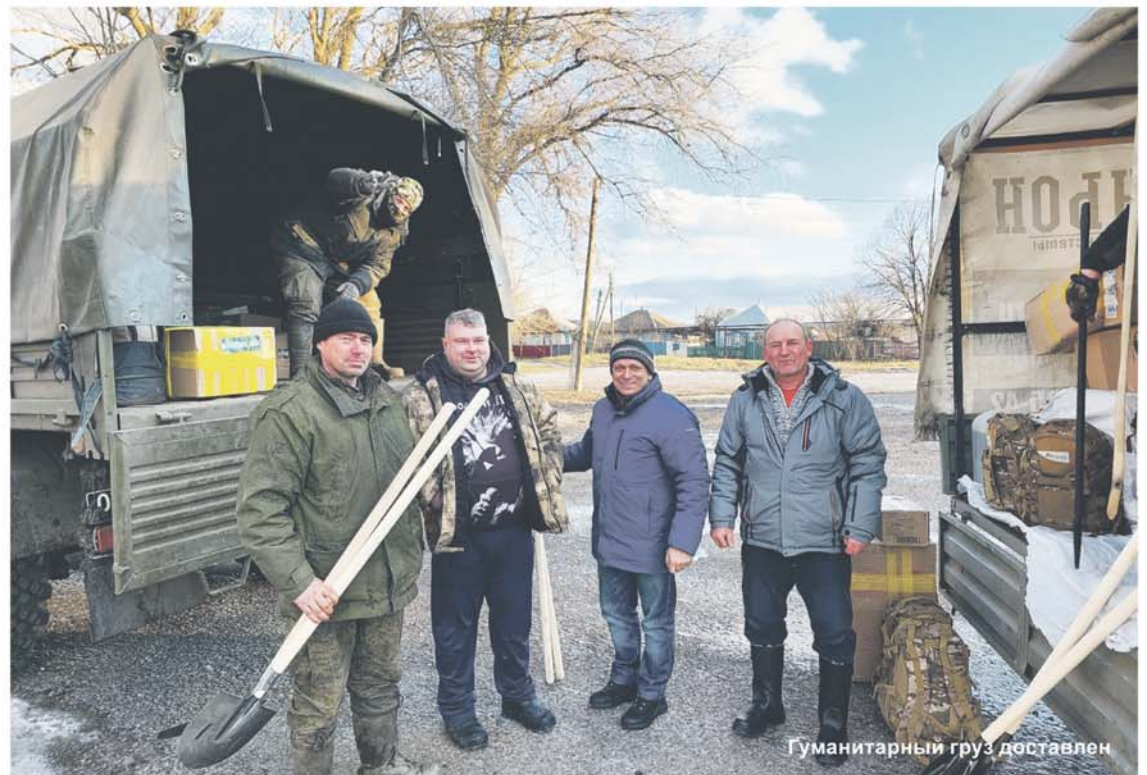
Гуманитарный груз доставлен