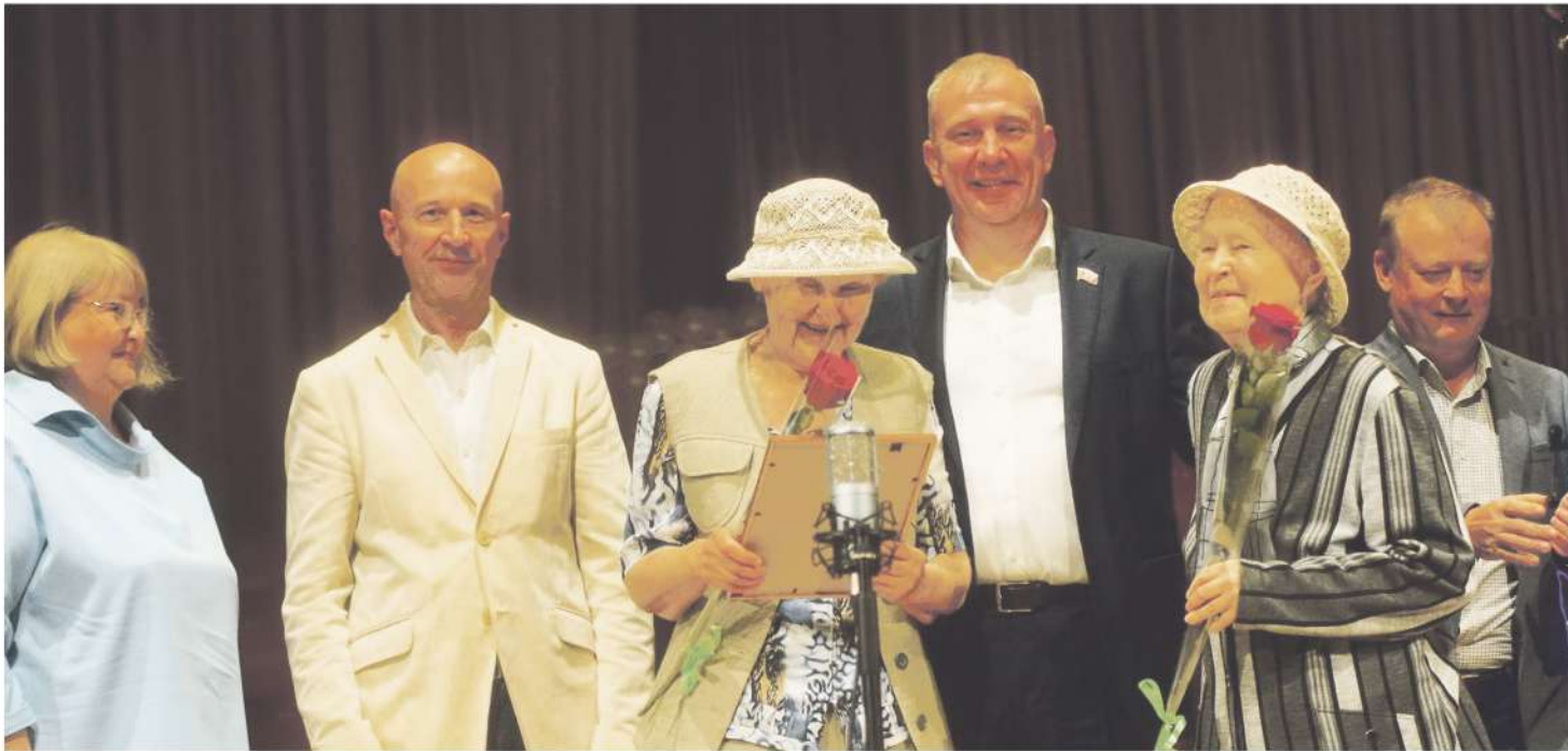
Чествование представителей семейных династий

14 сентября в Редкино отметили юбилей поселка – 85 лет! Сегодня это один из крупнейших поселков Тверской области с хорошей инфраструктурой, здесь живут и работают трудолюбивые, отзывчивые люди, из поколения в поколение бережно сохраняющие семейные традиции и любовь к малой родине.