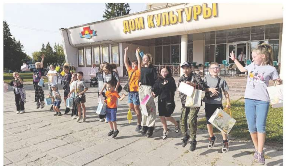
Конкурсно-развлекательная программа для детей и подростков

Подготовила Татьяна Крыльцова.