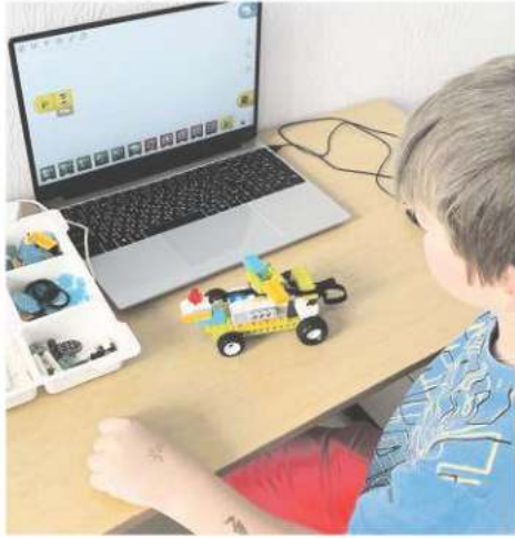
«АЛГОРИТМИКА» ДЛЯ ДЕТЕЙ ОТ 4 ЛЕТ

Это уникальное для города Конаково направление, где ребята узнают, что повседневная жизнь состоит из алгоритмов – правильной последовательности действий. Дети развивают пространственное мышление. Каждое занятие – это новая тема, которая готовит ребенка