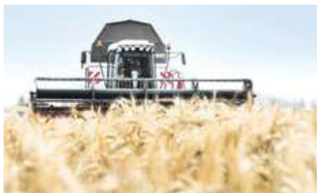
Урожайный год в Верхневолжье