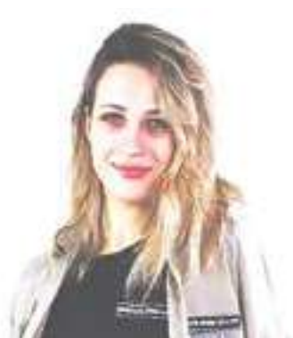
Социальный контракт: не откладывай мечты!