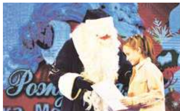
Дети поздравили главного волшебника страны