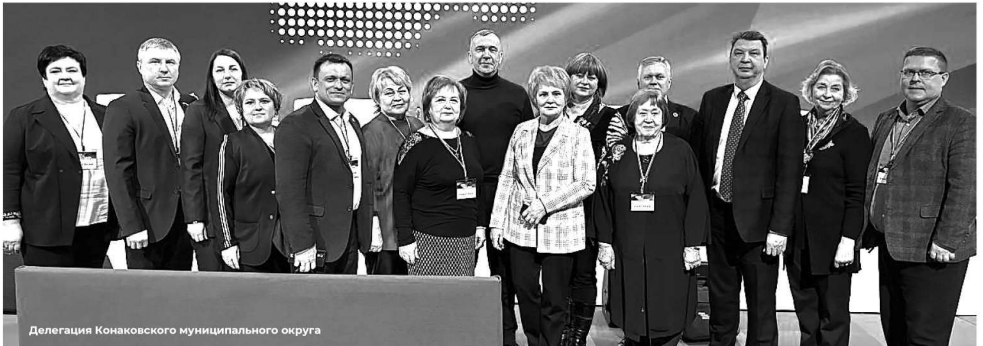
Делегация Конаковского муниципального округа