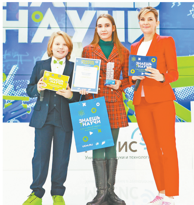
Александра с ведущими церемонии

8 февраля отмечался День российской науки. Этот праздник всегда имел для нашей страны большое значение. И в канун этого праздника школьница из Конаковской гимназии № 5 стала финалисткой всероссийского конкурса научно-популярных видео.