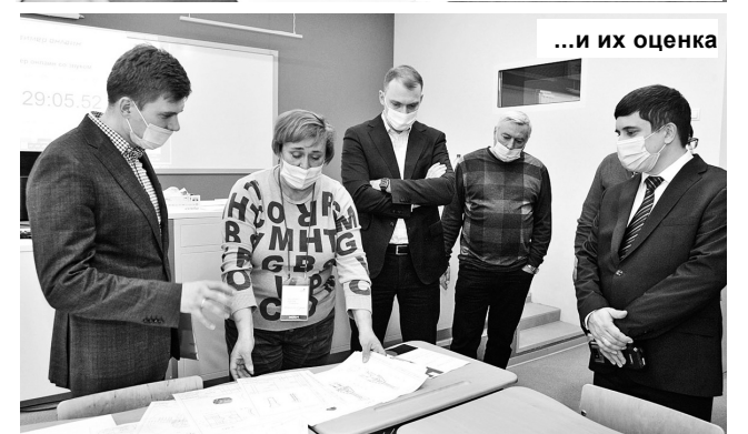
...и их оценка