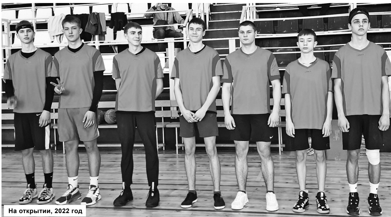
На открытии, 2022 год

чемпионата ШБЛ «КЭС-БАСКЕТ». Девушки из г. Нелидово были победителями суперфинала чемпионата ШБЛ «КЭС-БАСКЕТ» сезона 2014-2015 годов, а ржевские юноши - бронзовыми призёрами 2014-2015 годов и серебряными призёрами 2017-2018 годов.