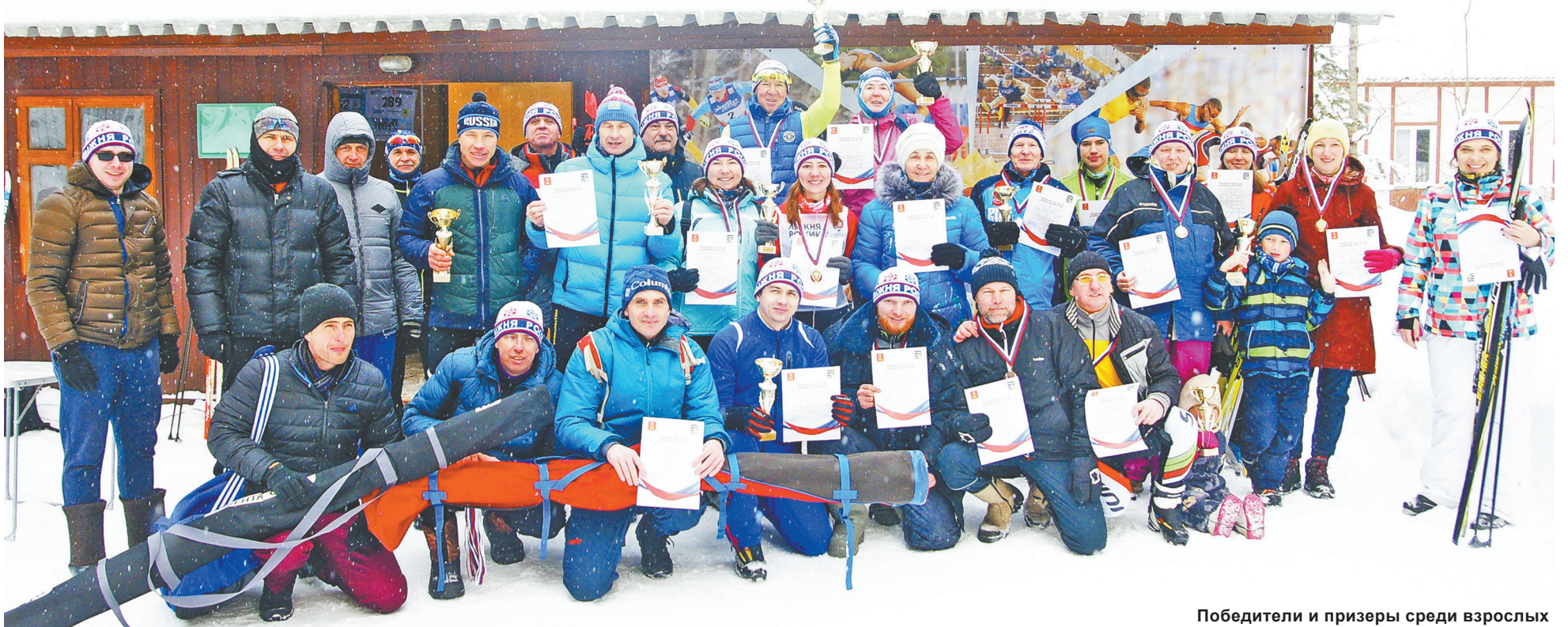
Победители и призеры среди взрослых