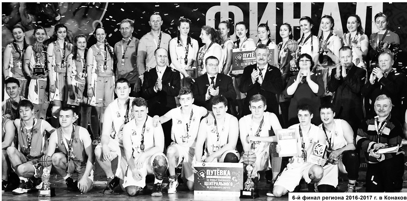
6-й финал региона 2016-2017 г. в Конаково