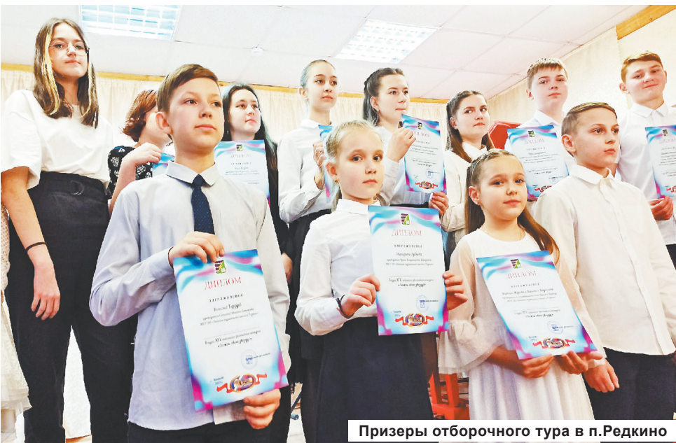
Призеры отборочного тура в п.Редкино

В субботу, 12 февраля, лауреаты I тура отправятся зажигать свои звезды в концертном зале Хоровой школы мальчиков и юношей в г. Конаково, где выступят перед областным жюри, состоящим из квалифицированных специалистов Тверского музыкального колледжа им. М.П.Мусоргского.