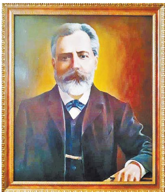
Конаково, 2022 год. Портрет с фото о. Петра (Карапета) Габриэляна. Конец 19 века. Художник Николай Шитиков. А. Баваров.

ПРОДАЕМ ЖИВУЮ ФОРЕЛЬ, СЕНО, СОЛОМУ, РЖАНУЮ И ОВСЯНУЮ, КУСТАРНИКОВЫЙ ПЕРЕГНОЙ, НАВОЗ. ТЕЛ. 4-57-70, 8-905-604-44-53.