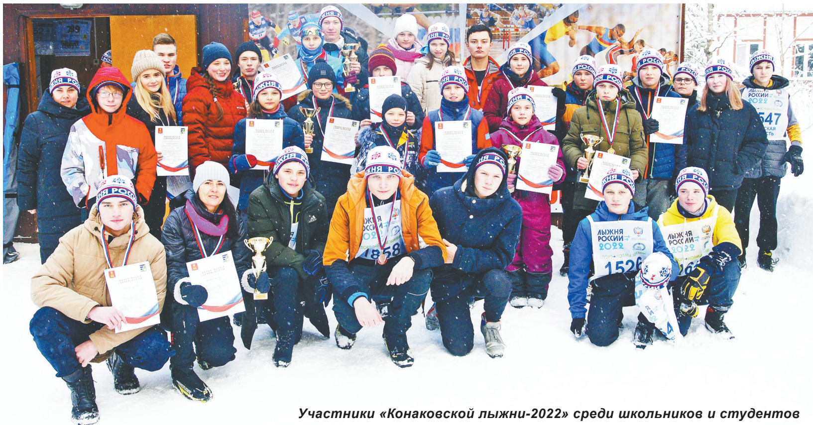
Участники «Конаковской лыжни-2022» среди школьников и студентов

15 февраля – День памяти о россиянах, исполнявших служебный долг за пределами Отечества