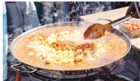
Главное блюдо фестиваля - птитим с креветками и сыром.