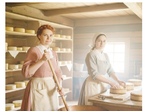
Новинка фестиваля - интерактивная фотозона с искусственным интеллектом.

Важно отметить, что организаторы с большим вниманием относятся к замечаниям и предложениям гостей фестиваля. Так в этом году было еще больше активностей для семей с детьми. Важно, что выросло и число бесплатных творческих мастер-классов. Их, при поддержке администрации муниципалитета, провели мастера своего дела из ДЮОЦ «Новая Корчева», Конаковской центральной библиотеки, Центра внешкольной работы и Детской школы искусств. Для детей уже традиционно развернулся «Островок детства», где воспитатели детского сада №1 г. Конаково подготовили игры и театральные постановки. Можно было поиграть в знаменитые дворовые игры со студентами Конаковского колледжа и активистами движения «Первые». Также студенты колледжа провели вкусные мастер-классы. В творческой зоне каждый смог найти занятие себе по душе и унести с собой воспоминания о фестивале, сделанные своими руками.