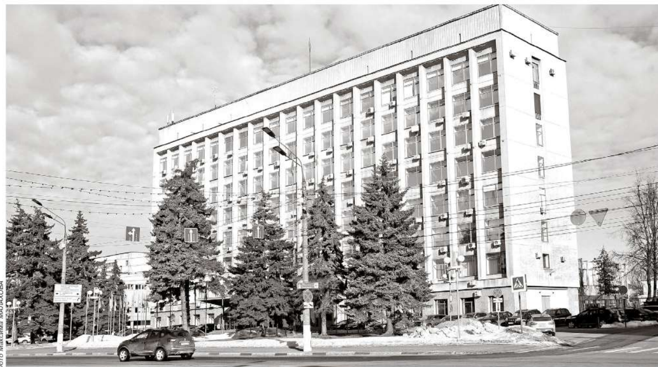
Здание Законодательного Собрания, расположенное на ул. Советской, 33 является архитектурной доминантой современной Твери

Среди традиций нашего областного парламента надо прежде всего выделить преемственность депутатского корпуса. 30-40% депутатов как правило переизбираются в новый состав, что позволяет сохранить опыт, понимание того как работают законотворческие механизмы, как на практике действуют законы.