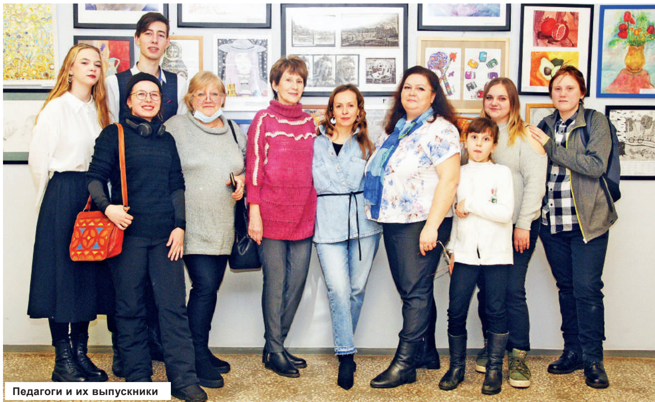
Педагоги и их выпускники