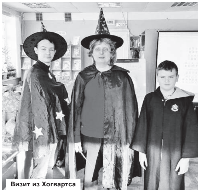
Визит из Хогвартса

Конаковская центральная детская библиотека регулярно проводит различные интересные мероприятия для своих юных читателей, где в игровой форме знакомит с детскими писателями и их произведениями.