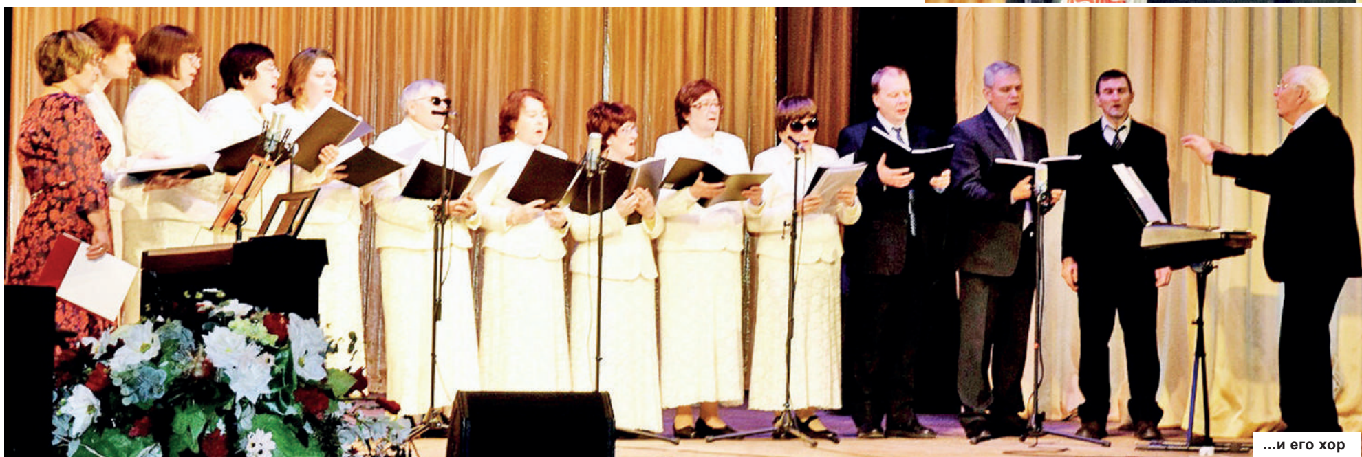
...и его хор