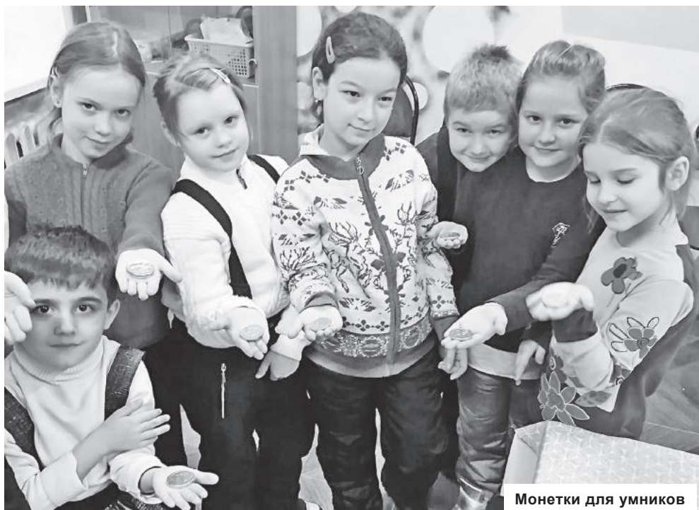
Монетки для умников

Конаковская центральная детская библиотека.