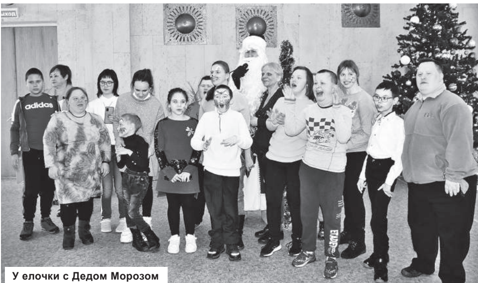
У елочки с Дедом Морозом