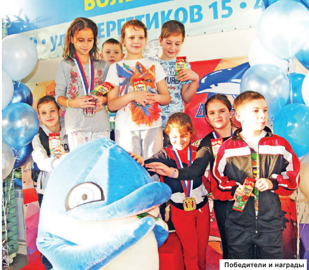
Победители и награды

Впервые турнир по плаванию с таким названием прошел во Дворце спорта «Дельфин» в 2017 году. Радует, что он стал традиционным. Эти соревнования дают возможность показать свои навыки на голубых дорожках и тем, кто только научился держаться на воде, и тем, кто уже выполняет юношеские и даже взрослые разряды. Самому маленькому участнику было всего 4 года!