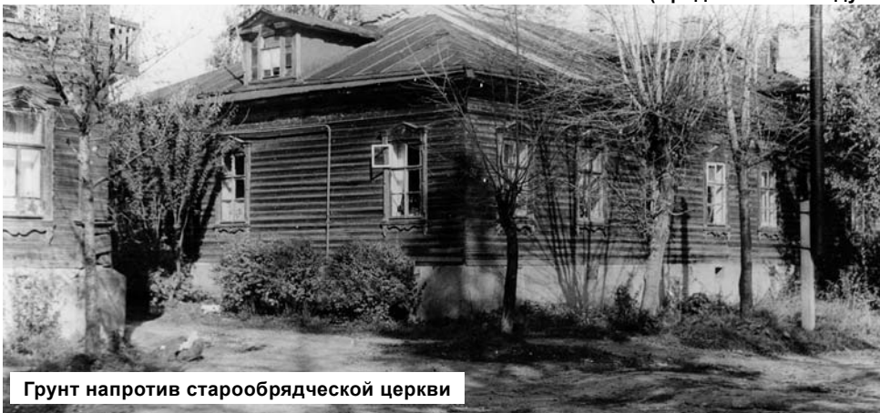
Грунт напротив старообрядческой церкви