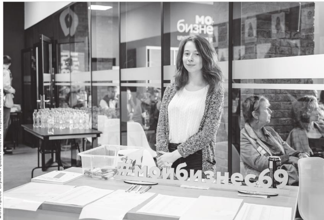
В центре поддержки предпринимательства «Мой бизнес» с 23 ноября стартует специальная образовательная программа для бизнес-леди

Подобная образовательная программа пройдет в Верхневолжье впервые и будет полностью бесплатной. В программе предусмотрены как офлайн-семинары, так и вебинары. 4 декабря, по окончании программы, состоится бизнес-девичник с вручением сертификатов, нетворкингом и фотосессией. Участие в образовательной программе бесплатно.