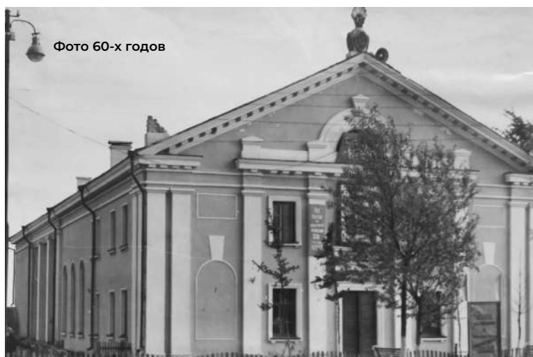
Фото 60-х годов

Сегодня КДЦ «Надежда» – это не просто место проведения досуга, это настоящий центр культурной жизни поселка. За более чем 70 лет своей истории он стал свидетелем множества значимых исторических событий и изменений. Несмотря на все трудности и испытания, коллектив Дома культуры сумел сохранить и приумножить традиции, привлечь еще больше посетителей самых разных возрастов.