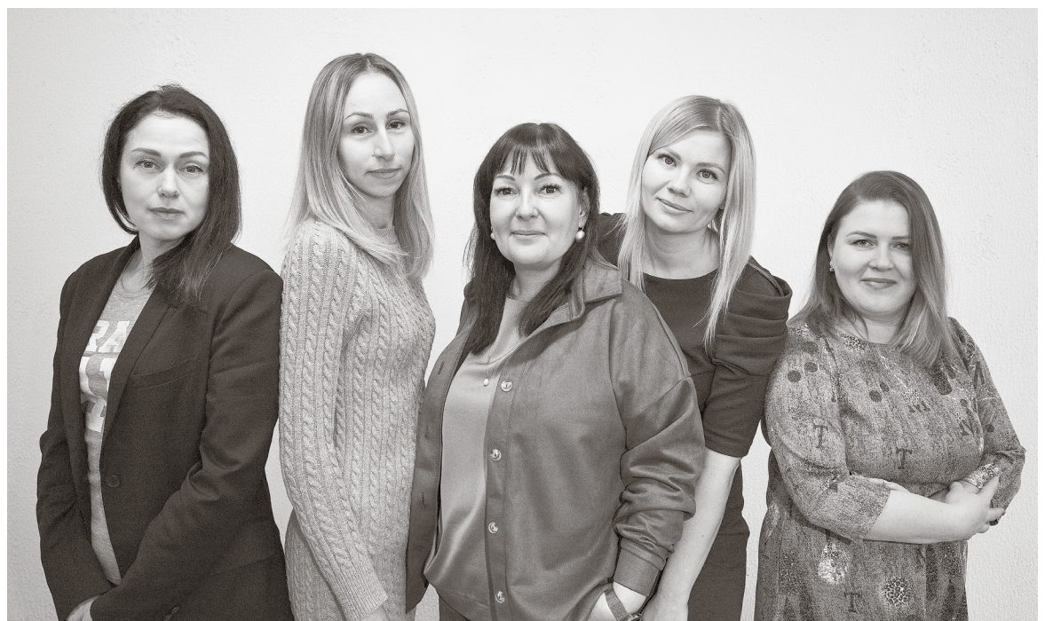
Коллектив Центра молодежной политики «Иволга»

лонтеры Победы». Подумав, я решила, что за 22 года своего существования ЦМП «Иволга» достоин принять участие в таком серьезном конкурсе, ведь наш Центр молодежной политики все эти годы непосредственно занимается воспитанием молодого поколения. Четыре года в нем развивается и успешно движется вперед «Юнармия», уже почти 10 лет – незаменимые на всех мероприятиях нашего округа «Волонтеры Победы», поэтому я рискнула и написала проект о работе, о будущих планах, о направлениях нашего Центра, о сотрудниках «Иволги», которые всегда рядом с воспитанниками. Было очень приятно, что наш проект победил и стал лауреатом «Националь-