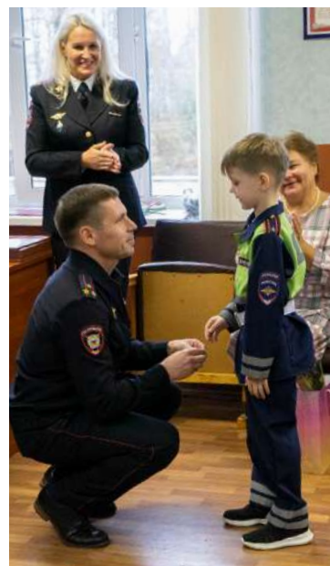
Подготовила Татьяна Крыльцова.

Хочется отметить, что сегодня ОМВД «Конаковский» – это, прежде всего, крепкий, профессиональный, сплоченный коллектив, где каждый сотрудник добросовестно и с честью несет службу на страже закона, защищая покой и безопасность жителей. Ведь неслучайно в этот замечательный день так часто звучали слова: «Служу России!».