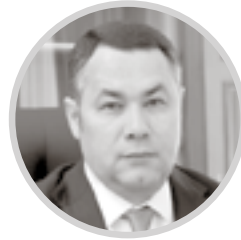
ИГОРЬ РУДЕНЯ Губернатор Тверской области

Верхневолжье по праву может гордиться тем, какое внимание уделяется семьям с детьми, какая поддержка оказывается многодетным семьям и как в целом поднимается престиж семьи, традиционных семейных ценностей. Реализация в регионе национального проекта «Демография» и задачи в сфере семейной и демографической политики на 2024 год обсудили на очередном заседании правительства Тверской области.