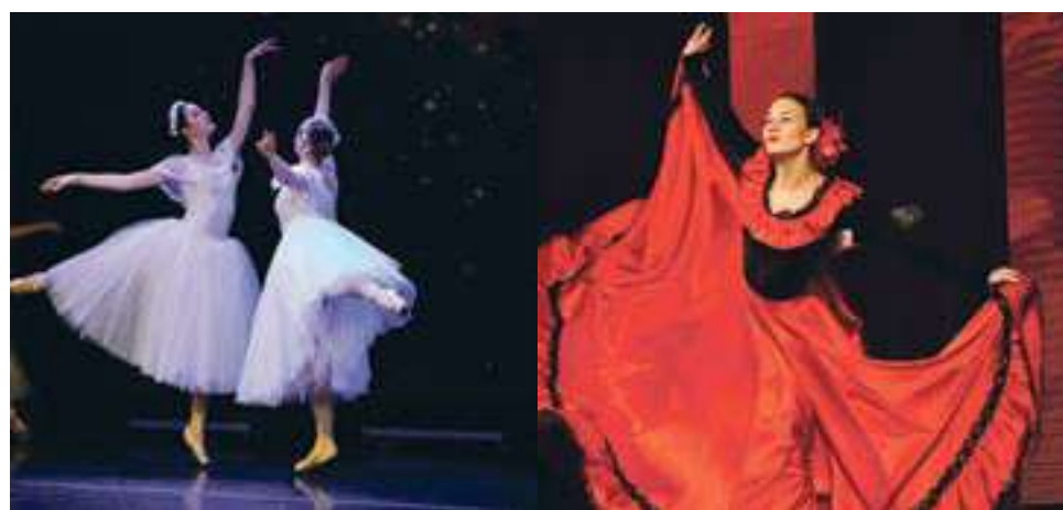
Подготовила Татьяна Крыльцова.

« В память о мастере, о профессионале, наверно, самое важное – это когда продолжается ее дело. И сегодняшний концерт – лучшее подтверждение этому. Я от всей души желаю Образцовой студии «Арабеск», новым и нынешним ее воспитанницам, как можно больше профессиональных побед. Потому что каждая победа, каждая награда, каждое выступление – это «букет» вашему педагогу. Пусть цветов в нем будет много, а память – долгой!» – обратилась к гостям и участникам концерта Аггюль Арифовна.