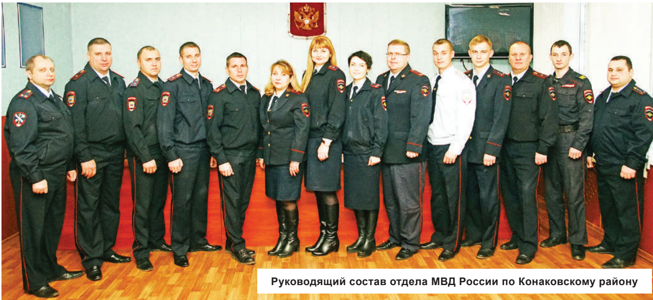
Руководящий состав отдела МВД России по Конаковскому району