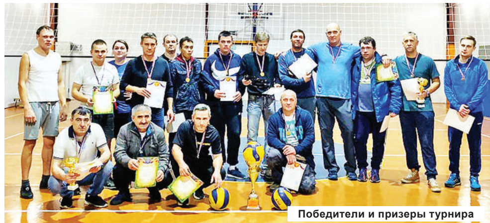
Победители и призы турнира

не у всех, но те, кто хотя бы раз побывал в Юрьево-Девичье, возвращаются сюда снова. За примерами далеко ходить не нужно – команды из Вахонино и Мокшино за последний год посетили все волейбольные турниры, организованные в селе. Едут не только ради тёплого приёма, но и для хорошей игры.