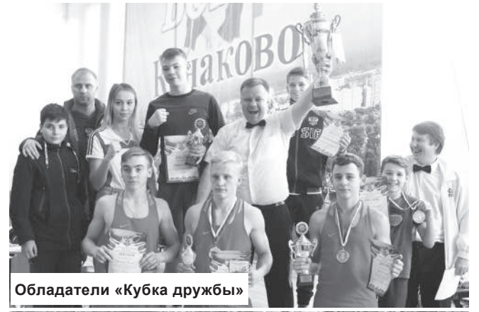
Обладатели «Кубка дружбы»