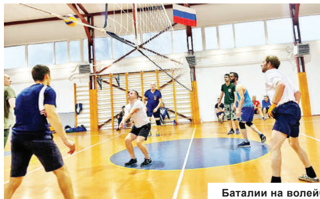
Баталии на волейбольной площадке