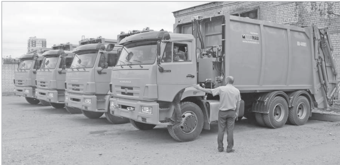
В основе новой системы обращения с ТКО – передовые технологии и строгие экологические стандарты безопасности

Мусорную реформу, к которой готовились весь прошлый год, в нашем регионе запустили в январе 2019-го. И все это время решали не только организационные вопросы – приобретение и установка новых контейнеров, закупка специальной техники, оптимизация взаимодействия регионального оператора ООО «ТСАХ» с