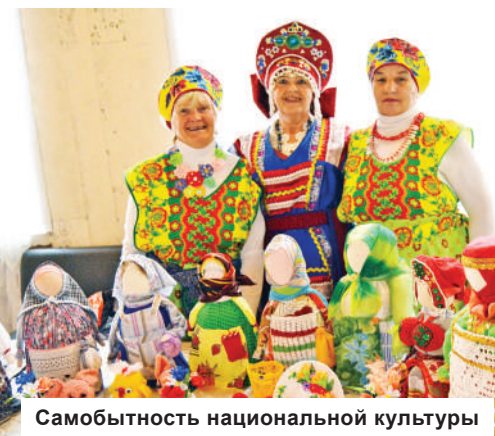
Самобытность национальной культуры