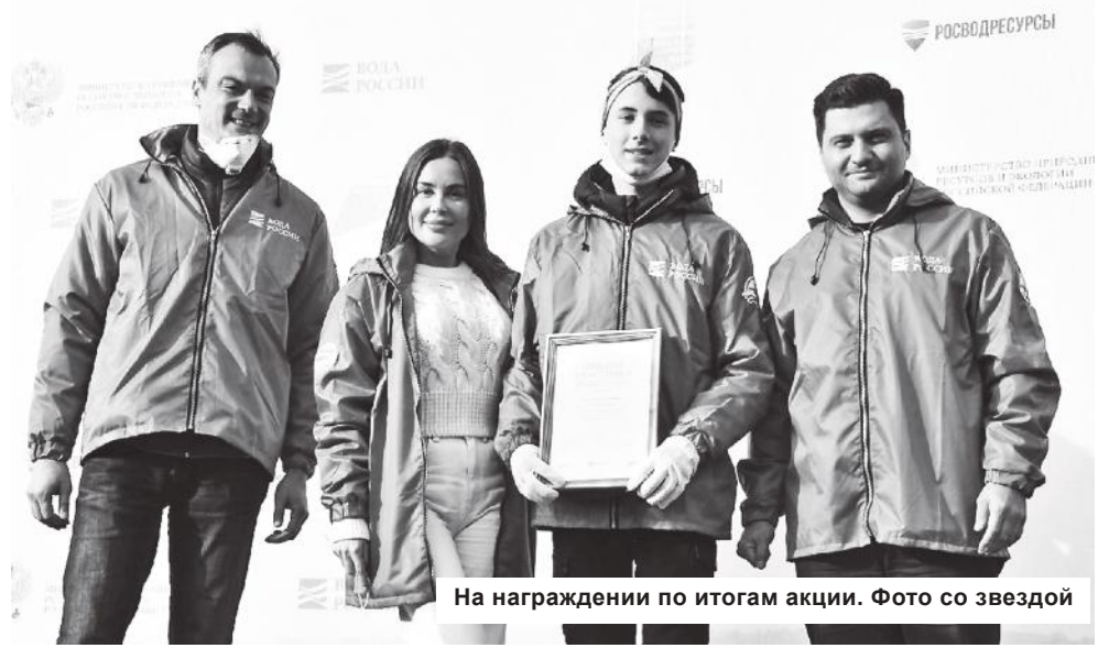
На награждении по итогам акции. Фото со звездой

Поддерживать экологов и принять участие в уборке Волги приехал один из создателей акции «Вода России», директор ФГБУ «Центр развития водохозяйственного ком-