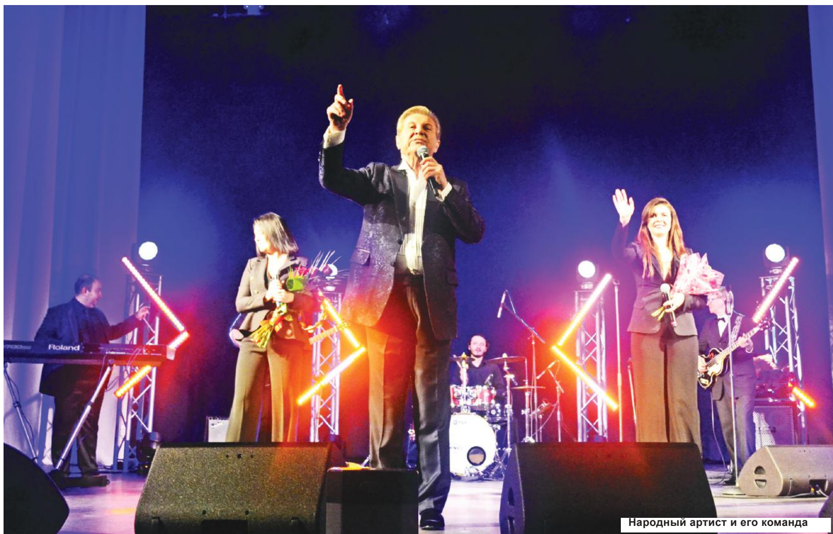
Народный артист и его команда

Посетители ко всем мерам отнеслись с пониманием, а маски не мешали подпевать любимые песни.