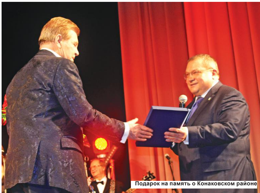
Подарок на память о Конаковском районе

29 октября в ДК «Современник» для жителей Конаковского района пел народный артист РСФСР, полный кавалер ордена «За заслуги перед Отечеством», лауреат премии Ленинского комсомола Лев Лещенко. Это благотворительный концерт в честь Года памяти и славы, посвящённого 75-летию Победы в Великой Отечественной войне.