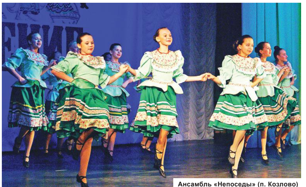
Ансамбль «Непоседы» (п. Козлово)