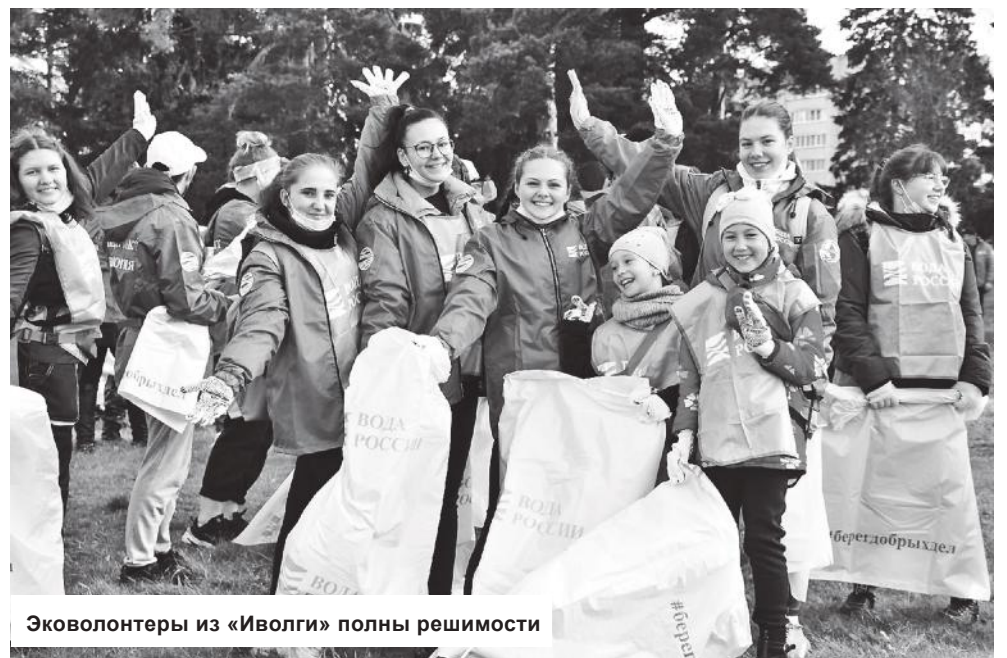
Эковолонтеры из «Иволги» полны решимости