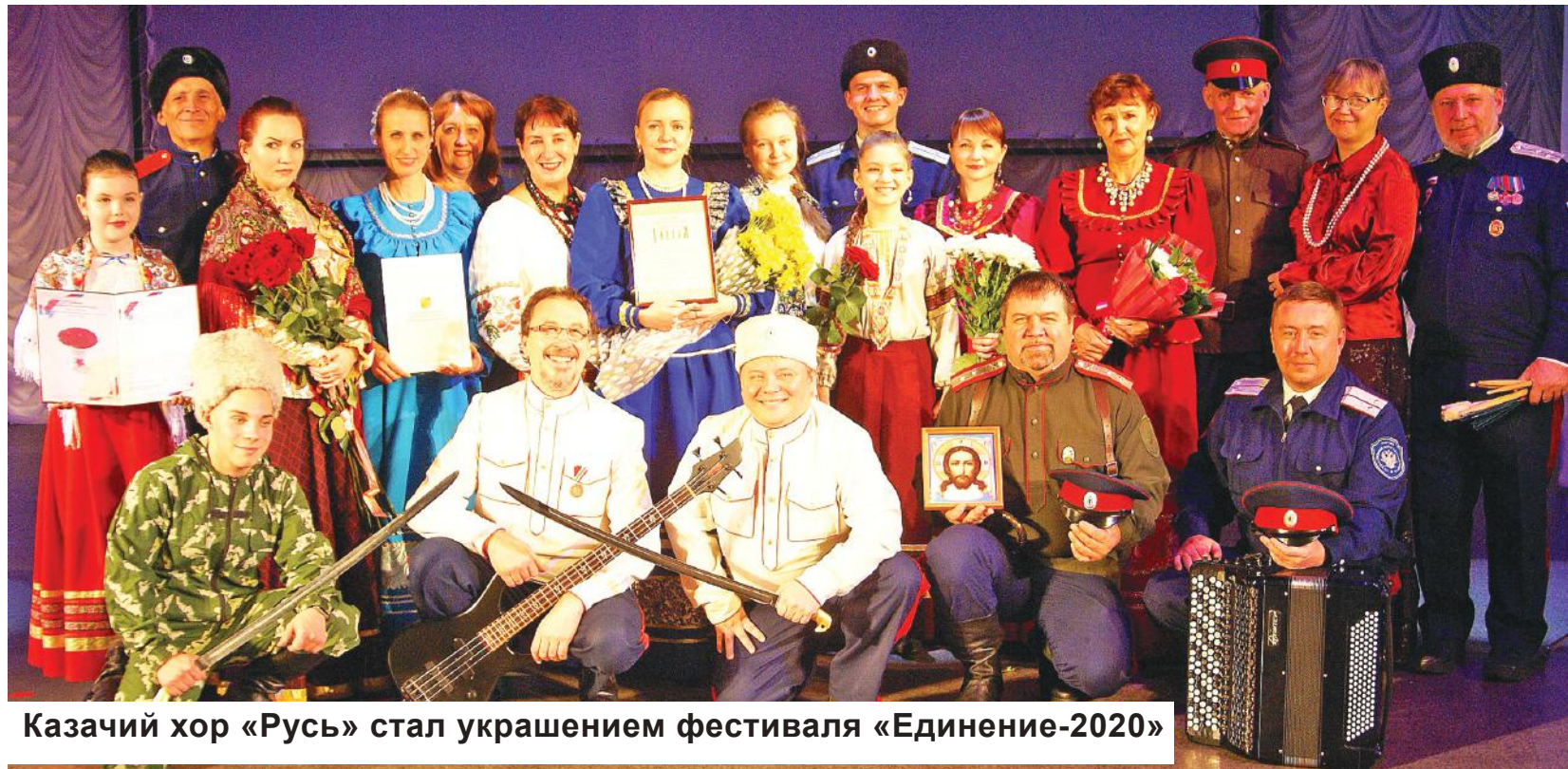
Казачий хор «Русь» стал украшением фестиваля «Единение-2020»