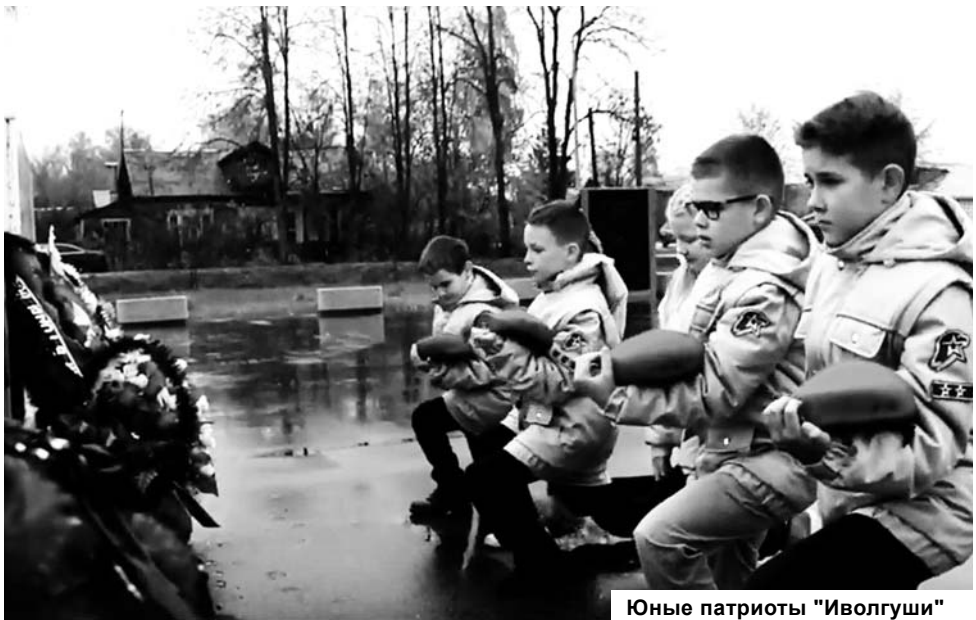
Юные патриоты «Иволгуши»

Малышковский отряд «Иволгуши» центра молодежной политики «Иволга» тоже принял участие в областной молодежной патриотической акции «День белых журавлей» в память о воинах, павших на полях сражений в Великой Отечественной войне. Ребята изготовили журавликов сами и возложили к мемориалу в Комсомольском сквере.