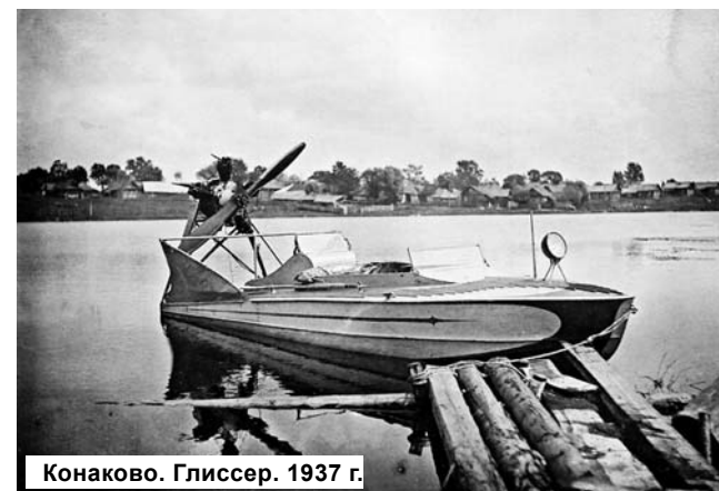
Конаково. Глиссер. 1937 г.

В летнее время на речке было множество стихийных пляжей. Купались возле шестой школы, на месте зимнего