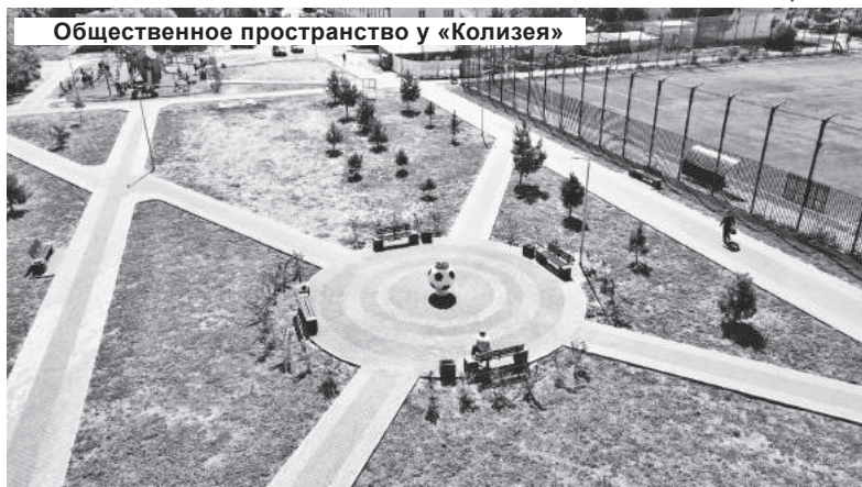
Общественное пространство у «Коллизея»

Подрядчик работ - ООО «СпецДорСтрой», проектировщик – АО «Проектный институт «Твержилкоммунпроект». Благоустройство набережной - это реализация проекта г. Конаково - победителя Всероссийского конкурса среди малых городов и исторических поселений 2020 года. В 2020 году конкурс проводился в четвёртый раз по поручению Президента Российской Федерации Владимира Путина. На обновление конаковской набережной из федерального бюджета выделено 70 миллионов рублей.