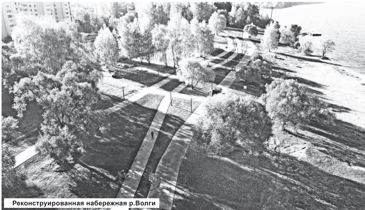
Реконструированная набережная р.Волги

Всего в 2021 году участниками проекта являются 38 муниципальных образований, заявлено благоустройство 100 объектов: 21 дворовой территории и 79 общественных пространств. Кроме того, в Верхневолжье благоустраиваются объекты - победители Всероссийского конкурса лучших проектов создания комфортной городской среды 2020 года. Работы ведутся в 6 муниципальных образованиях – Осташкове, Конакове, Бежецке, Торопце,