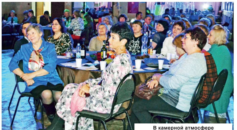
В камерной атмосфере