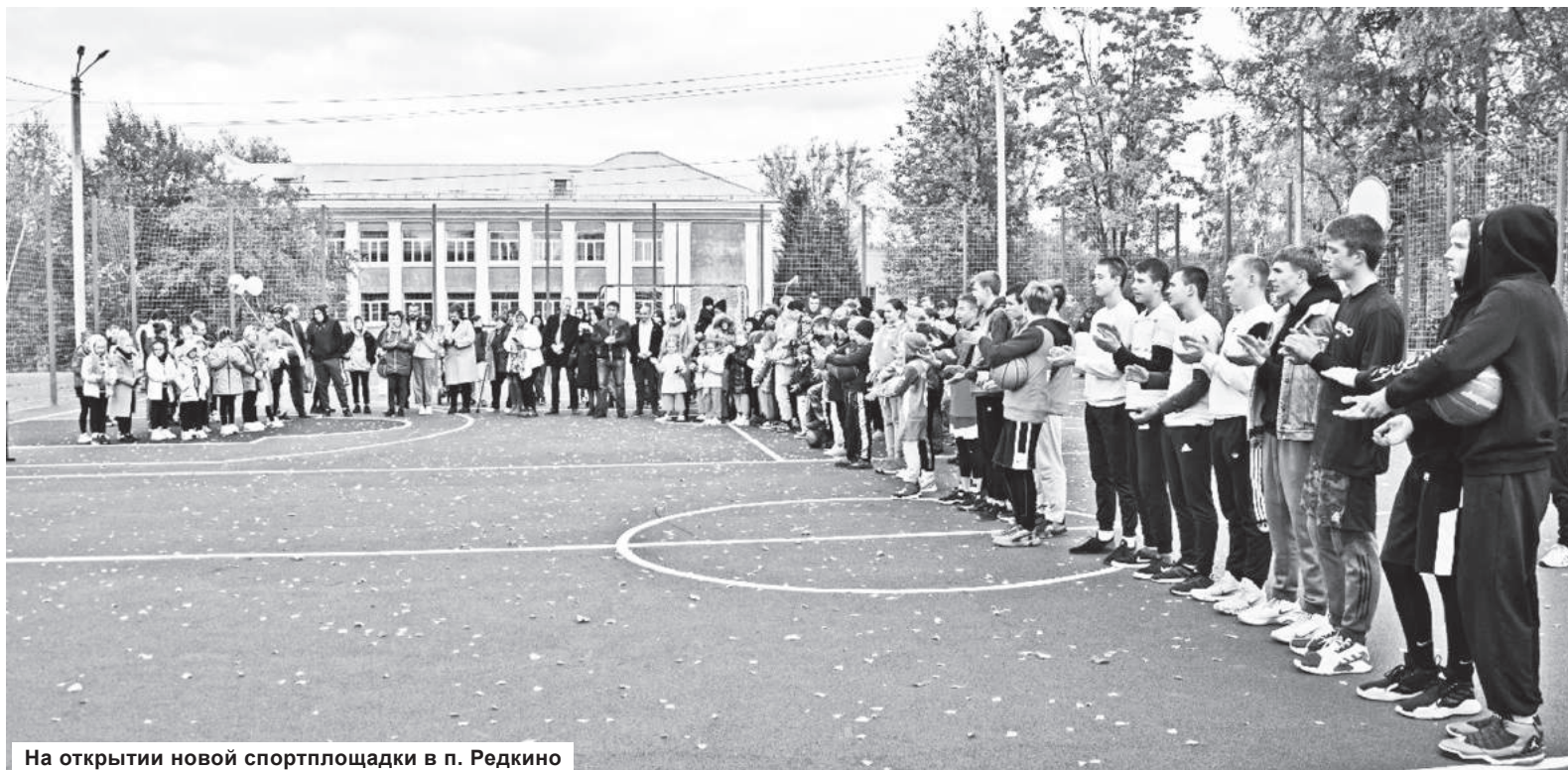
На открытии новой спортплощадки в п. Редкино

Остается только напомнить, что программа поддержки местных инициатив успешно развивается в Тверской области с 2013 года, и главной ее особенностью является то, что проекты для реализации инициируют сами жители территорий. Количество ежегодно реализуемых проектов выросло в 6 раз. За период с 2015 по 2020 год количество заявок возросло на 93 процента – со 168 до 325, кроме того, на 56 процентов увеличен объем субсидии, предоставленной на реализацию программы.