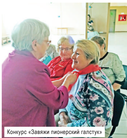
Конкурс «Завяжи пионерский галстук»