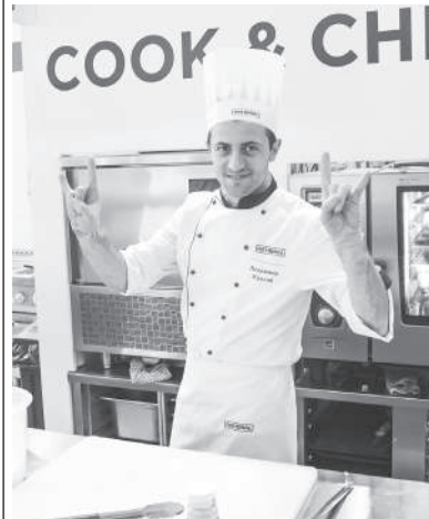
Мастер-классы от профессионалов