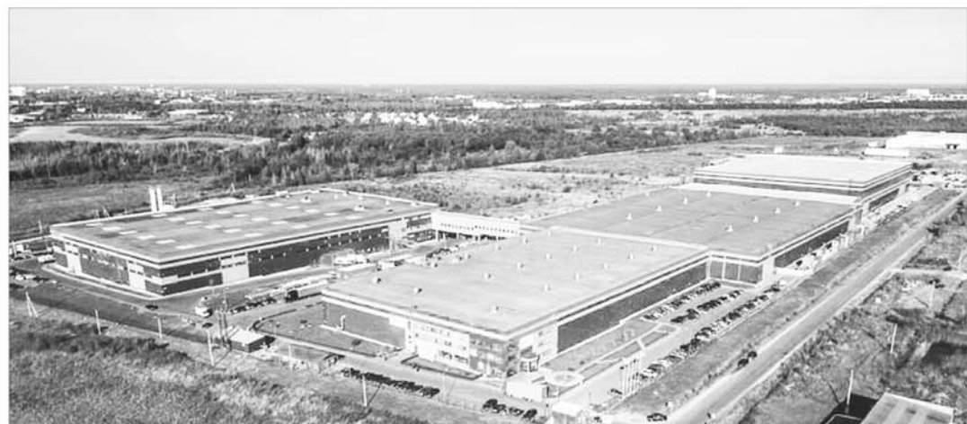
В 2022 году заключен контракт на ремонт подъезда к промышленной зоне Боровлево в Калининском районе

В 2020 году выплаты на погашение ипотеки получили 87 семей, а в 2021-м – 124 семьи.