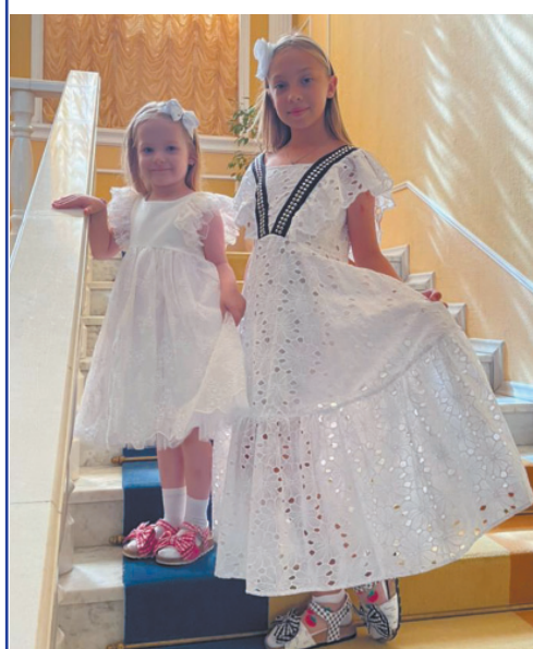
Настена-сластена и Розочка. Будущие королевы красоты.