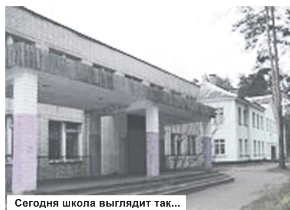
Сегодня школа выглядит так...

Это не только поможет школе преобразиться, но и привлечет большее количество учащихся и родителей, мотивированных на обучение в этом учреждении.