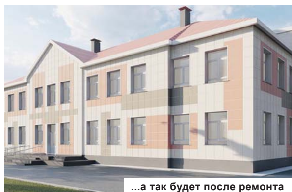
...а так будет после ремонта