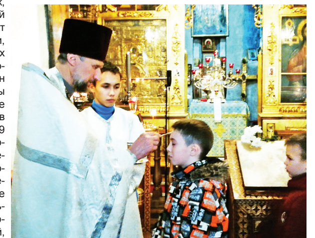
НА СНИМКЕ: в крещенский сочельник в Городенском храме.

В сочельник, день, который предшествует крещенской ночи, во всех церквях совершалось водосвятие. А чин великой агиасмы на Богоявление совершался в ночь с 18 на 19 января. В эти моменты посещение людьми божьих храмов увеличивается. Все хотят проникнуться соответствующей атмосферой, набрать впрок святой воды, чьи чудесные целительные свойства, по поверьям, сохраняются в течение всего следующего года. Так это или нет – знают только верующие. Но одно из чудес – это то, что освященная в крещенскую ночь вода не портится весь год – это факт.