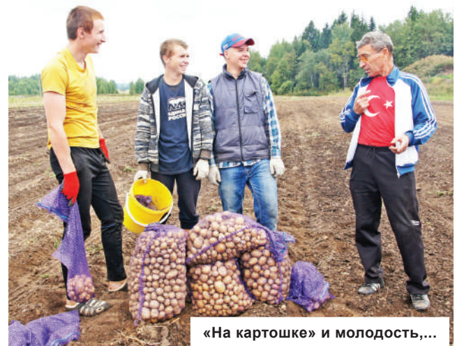
«На картошке» и молодость,...

А известная эпопея с марьинским аэродромом сельхозавиации? Долгое время