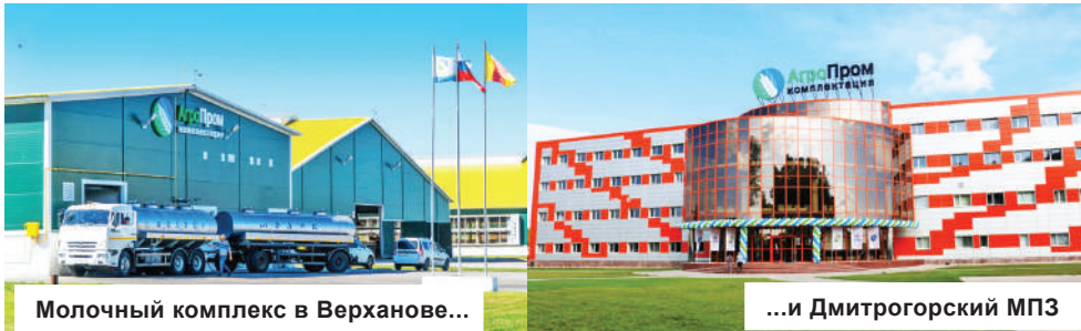
Молочный комплекс в Верховнове...