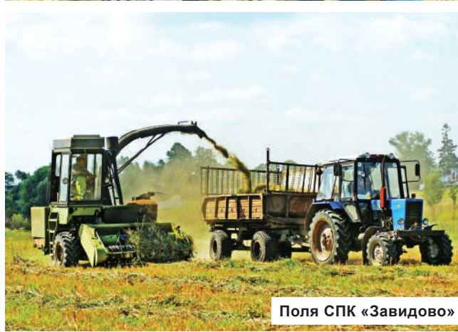
Поля СПК «Завидово»