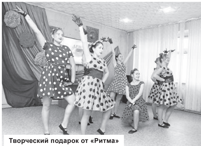
Творческий подарок от «Ритма»

ниципальной службы задавали порой и довольно острые вопросы. Они касались перспектив развития района, в частности, размещения новых предприятий и создания новых рабочих мест, открытия филиалов высших учебных заведений (в свое время у нас их было несколько, теперь - ни одного), вопрос жилья для молодых семей и заработных плат бюджетникам, мест в детских садах. Особую тревогу у людей старшего поколения вызывает состояние нашей медицины, особенно отсутствие роддома и санэпидстанции. На все вопросы отвечал глава района и его заместители. В рамках дан-