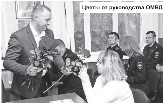
Цветы от руководства ОМВД