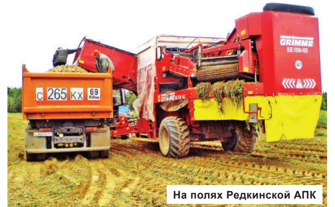
На полях Редкинской АПК

вольственную безопасность нашей страны, дает рабочие места многим тысячам людей, участвует в федеральных программах по развитию АПК и отчисляет сотни миллионов налогов ежегодно. Конаковский район является