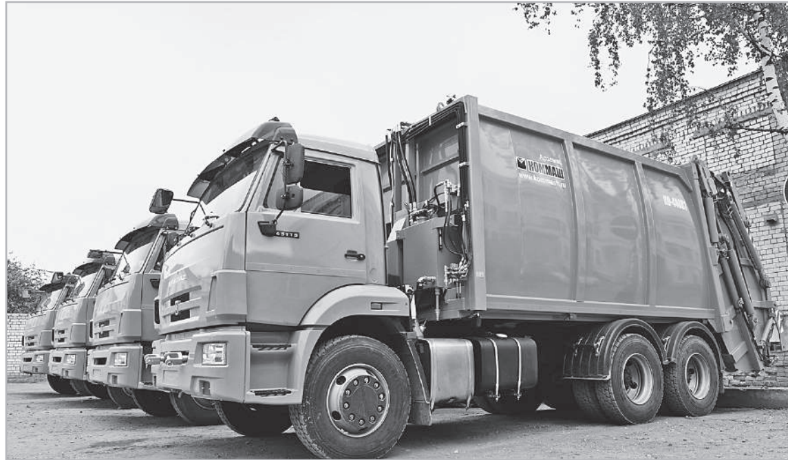
В 2019 году для сбора и вывоза мусора в Тверской области будет закуплено 30 единиц спецтехники и 1200 евроконтейнеров. Часть оборудования и машин уже поступила и введена в работу

В Тверской области приступают к рекультивации старых свалок