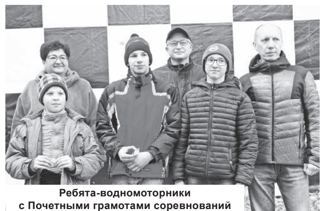
Ребята-водномоторники с Почетными грамотами соревнований

Также отмечен внушительный результат у взрослых гонщиков, которые приняли участие в открытых международных соревнованиях на Кубок ДОСААФ по водно-моторному спорту. Он проходил в Гомеле (Республика Беларусь), и в нем приняли участие 20 команд из Республики Беларусь, России, Латвии,