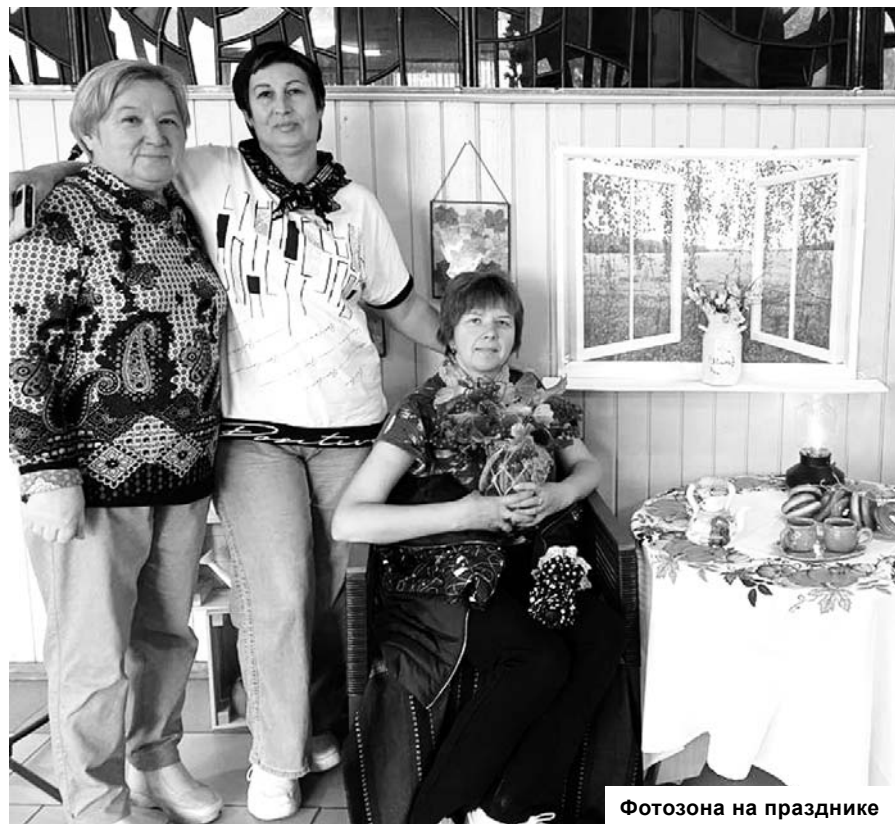
Фотозона на празднике

Праздник подарил много положительных эмоций, поднял настроение в эту серую осеннюю пору.