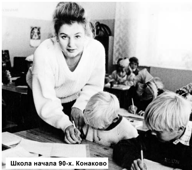
Школа начала 90-х. Конаково