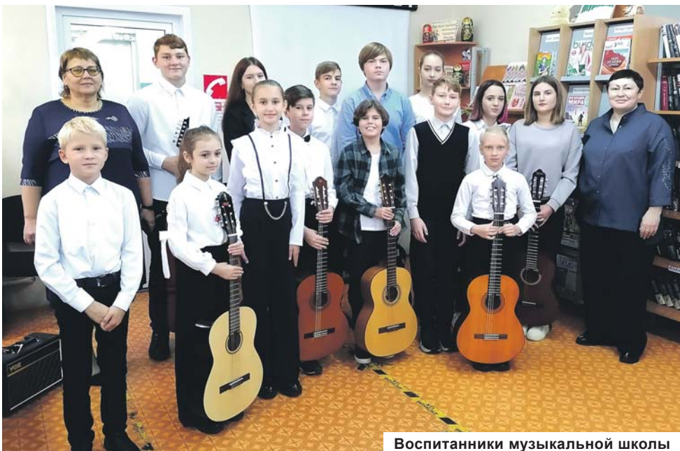
Воспитанники музыкальной школы