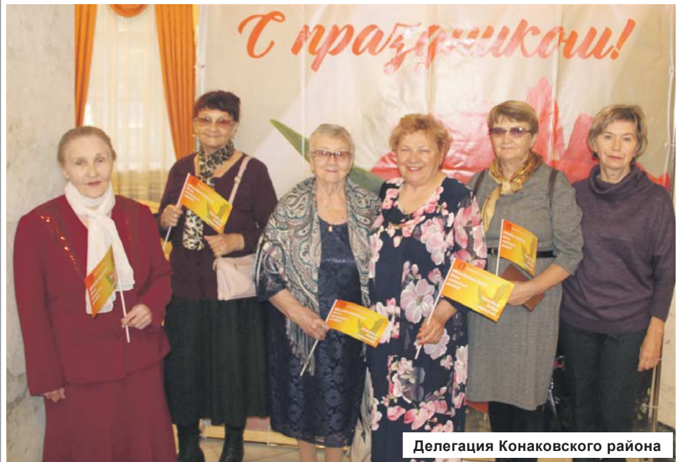
Делегация Конаковского района

30 сентября делегация от ГБУ «Комплексный центр социального обслуживания населения» Конаковского района посетила мероприятие в Твери, посвященное Международному дню пожилых людей. В состав делегации вошли ветераны труда, активисты общественных организаций, дети войны.