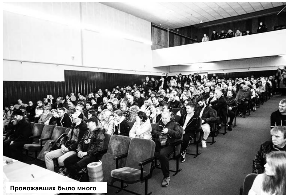
Провожавших было много

Телефон приемной администрации Конаковского района всегда в доступе — 49777. В любое время