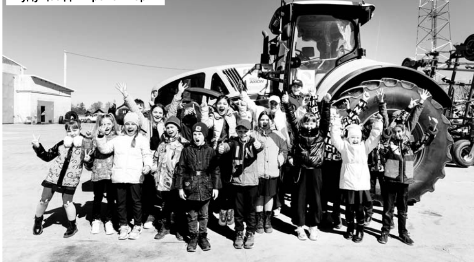
Будущее Дмитровой Горы