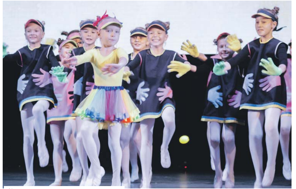
Концерт для старшего поколения