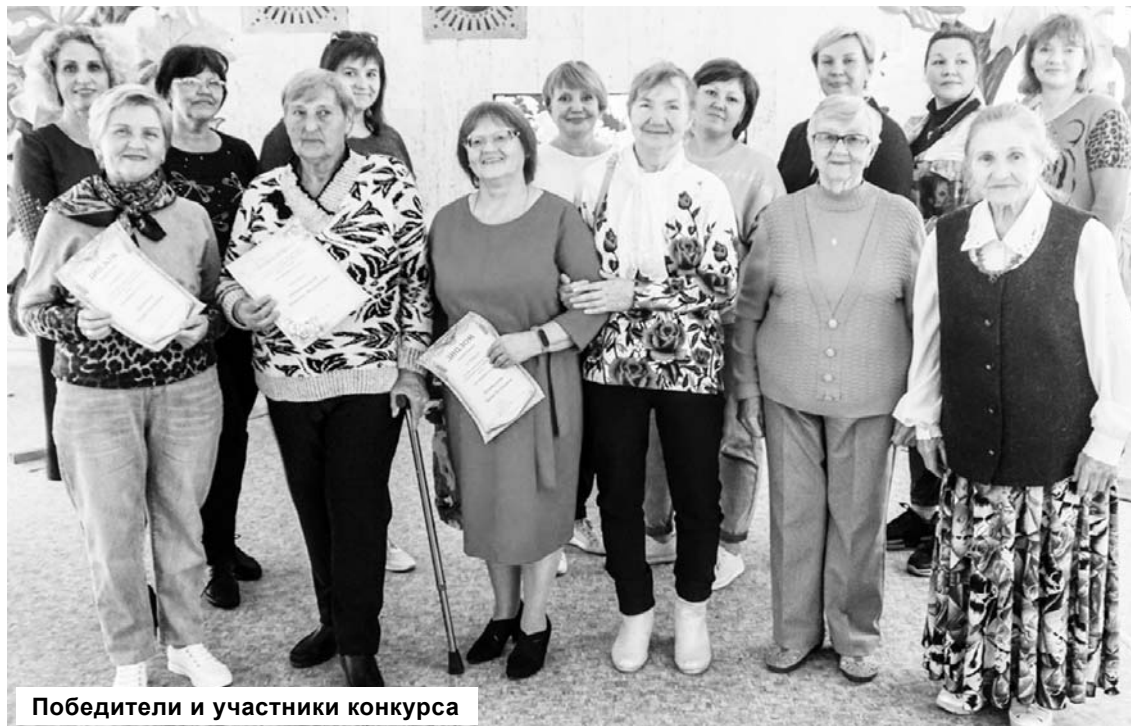
Победители и участники конкурса