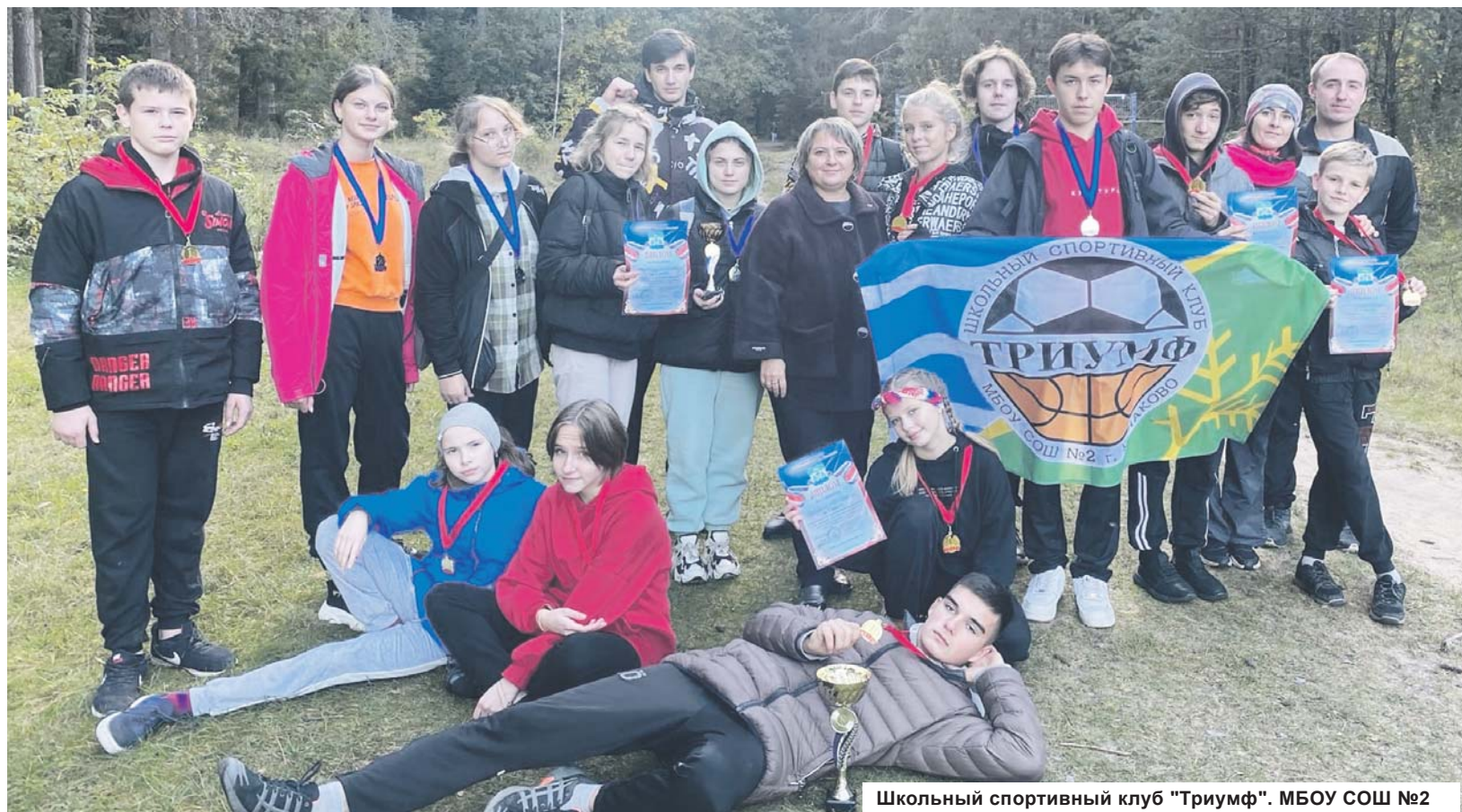
Школьный спортивный клуб "Триумф". МБОУ СОШ №2