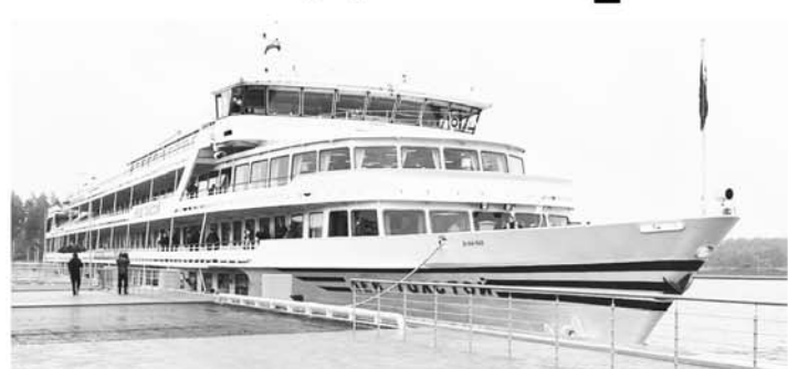
Пассажирский теплоход «Лев Толстой» впервые в новом порту в Завидово

24 сентября в новый речной порт в Завидово, созданный в рамках развития логистической инфраструктуры туристического кластера «Волжское море», впервые причалил теплоход под названием «Лев Толстой». Его пассажирами стали 170 человек,