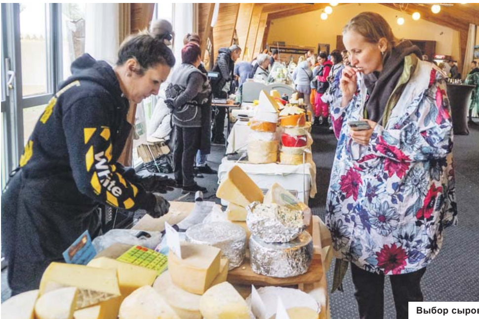
Выбор сыров был огромный