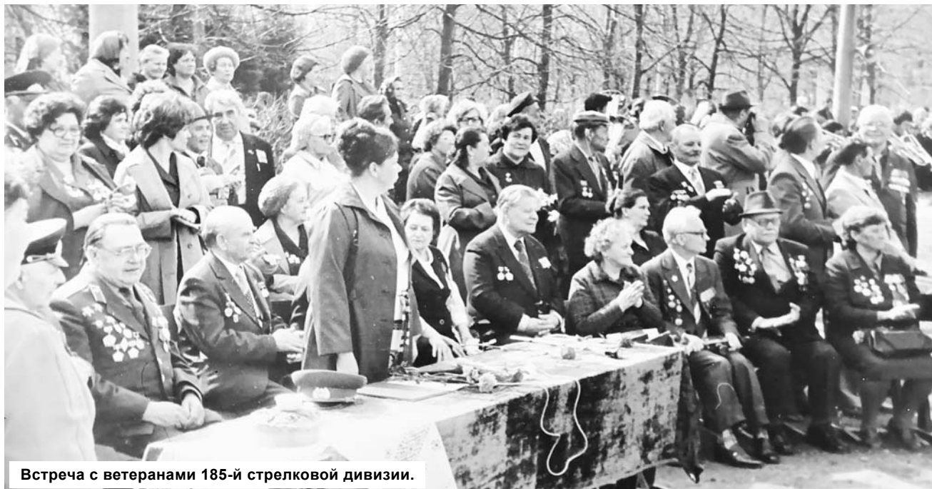
Встреча с ветеранами 185-й стрелковой дивизии.