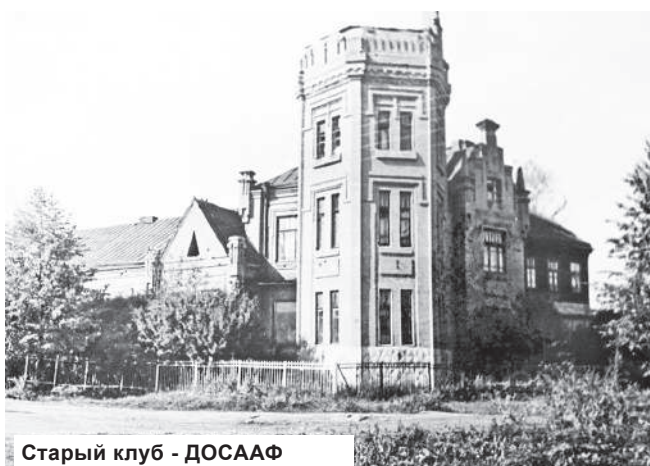
Старый клуб - ДОСААФ