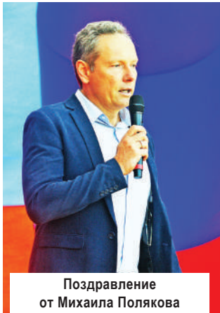
Поздравление от Михаила Полякова

Вахонинское сельское поселение - одно из самых притягательных мест на территории Конаковского района. Площадью оно около 55 квадратных километров, и протяженность живописнейших волжских берегов - порядка 20 километров. В его состав входят 19 населенных пунктов общей численностью населения 1686 человек. Самые крупные - это деревня Вахонино, которая была образована в 1654 году. С 1970 года д. Вахонино является центральной усадьбой Вахонинского сельского поселения. Другие крупные населенные пункты - это село Свердловло, где расположен один из старейших храмов района, деревня Новошино, поселок Второе Моховое. На территории Вахонинского сельского поселения расположены 26 садоводческих товариществ, 14 предприятий и организаций, среди которых отель-ресторан «Дафна» (с. Свердловло), госкомплекс «Завидово (база отдыха дипломатического корпуса).