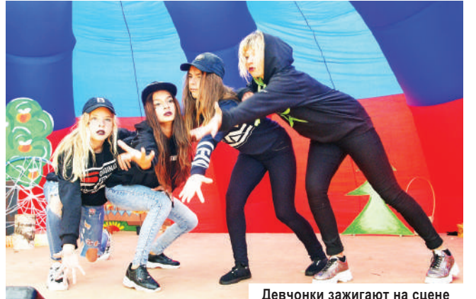
Девочки зажигают на сцене