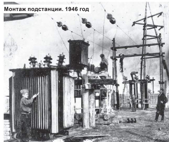
Монтаж подстанции. 1946 год

ДОПОЛНЕНИЕ. До середины 60-х годов напряжение в городской сети было 127 в, но в домах с середины 50-х годов уже была бытовая техника. Пылесосы, холодильники, стиральные машины, утюги включались в сеть через самодельные трансформаторы. Свет часто отключали в связи с авариями на ЛЭП. В 1964 году, когда вступил в эксплуатацию 1 блок Конаковской ГРЭС, подача электроэнергии стала стабильной, началась массовая электрификация деревень Конаковского района.