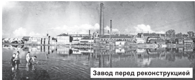
Завод перед реконструкцией

до наших дней. Оно находится на углу улиц Народная и 1-я Набережная – это здание спортивно-технического клуба РОСТО ( ДОСААФ). За несколько лет до открытия электротheaterа на ручье была построена трехэтажная башня с толстыми стенами, внутри которых находились насосы, они накачивали воду на уровень третьего этажа. Старинное оборудование сохранилось до сих пор. (Записано со слов слесаря-инструментальщика Евгения Дмитриевича