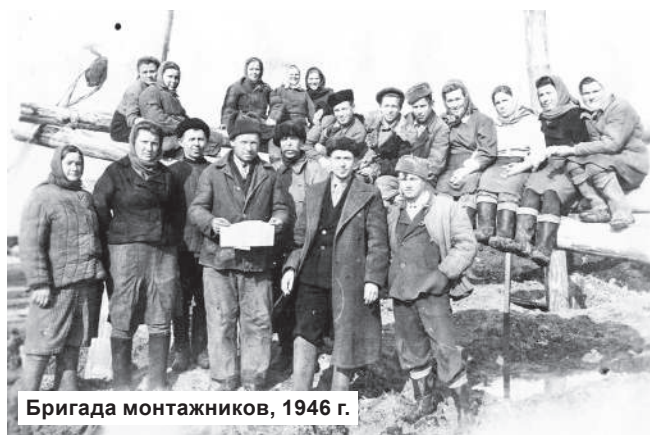
Бригада монтажников, 1946 г.