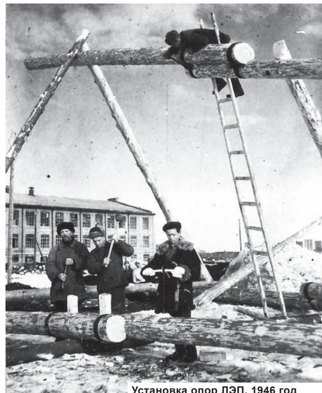
Установка опор ЛЭП. 1946 год

Если конкурс, что называется, состоится, и предлагаемых материалов будет в достаточном количестве, то читатели, приславшие наиболее интересные фотографии с рассказами, будут поощрены памятными призами от «Зари».