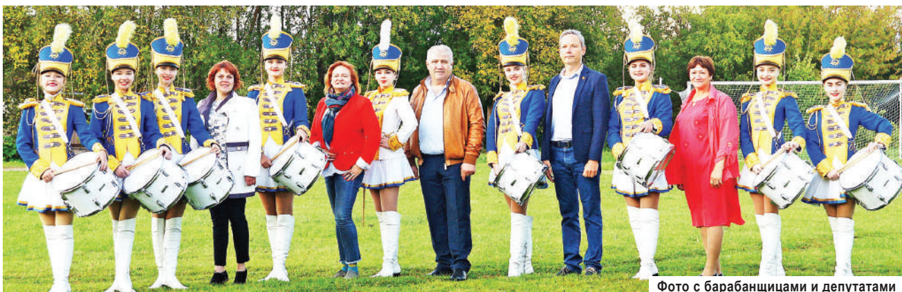
Фото с барабанщицами и депутатами