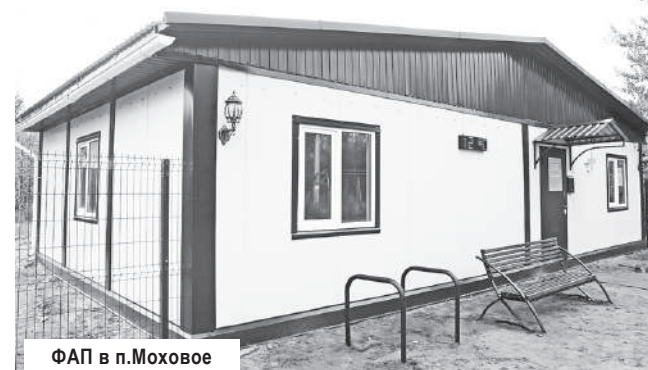
ФАП в п. Моховое