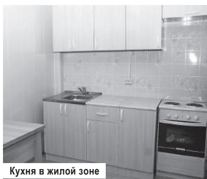
Кухня в жилой зоне