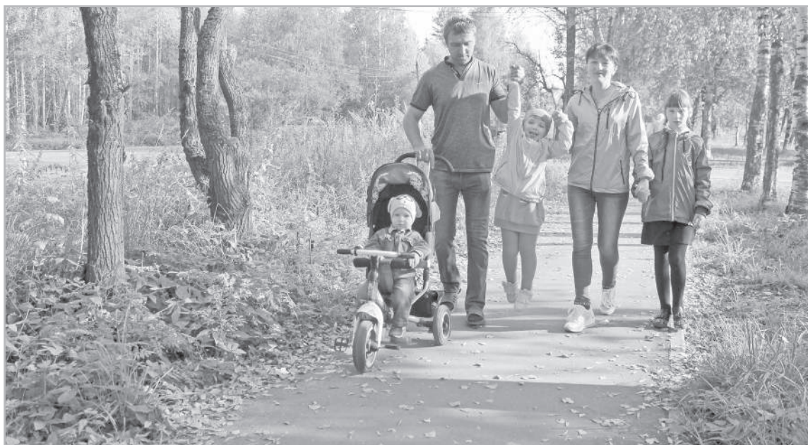
Большая семья – тверская традиция. И эта традиция постепенно возрождается

В абсолютном выражении это прирост в 9,5 тысячи малышей. Сегодня в нашей области почти 237 тысяч детей. Цифры были представлены на заседании регионального правительства, посвященном совершенствованию системы социальной поддержки семей с детьми. Губернатор Игорь Руденя, открывая заседание, напомнил, что всемерная поддержка семьи и укрепление семейных ценностей определены Президентом Российской Федерации Владимиром Путиным ключевой за-