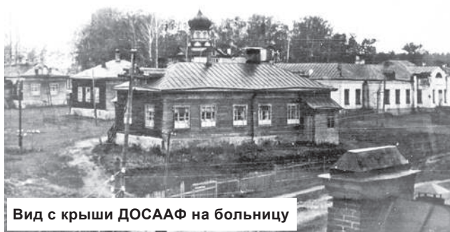
Вид с крыши ДОСААФ на больницу