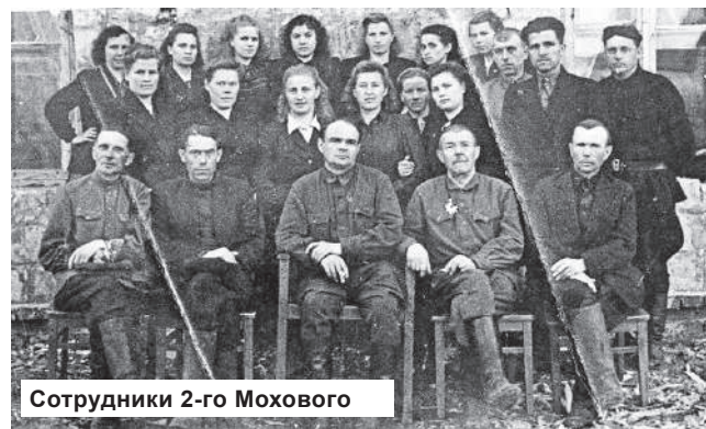
Сотрудники 2-го Мохового

ются два мощных паровых котла - «Фицнер и Гампер» производительностью по 6 тонн пара в час каждый.