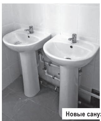
Новые санузлы выглядят так

Смотр-конкурс проводится ежегодно среди единых дежурно-диспетчерских служб всех муниципальных образований Тверской области (35 муниципальных районов и 8 городских округов). Непоколебимо высокий уровень профессионализма единой дежурно-диспетчерской службы администрации Конаковского района позволяет ей традиционно занимать лидирующие позиции в своём деле.