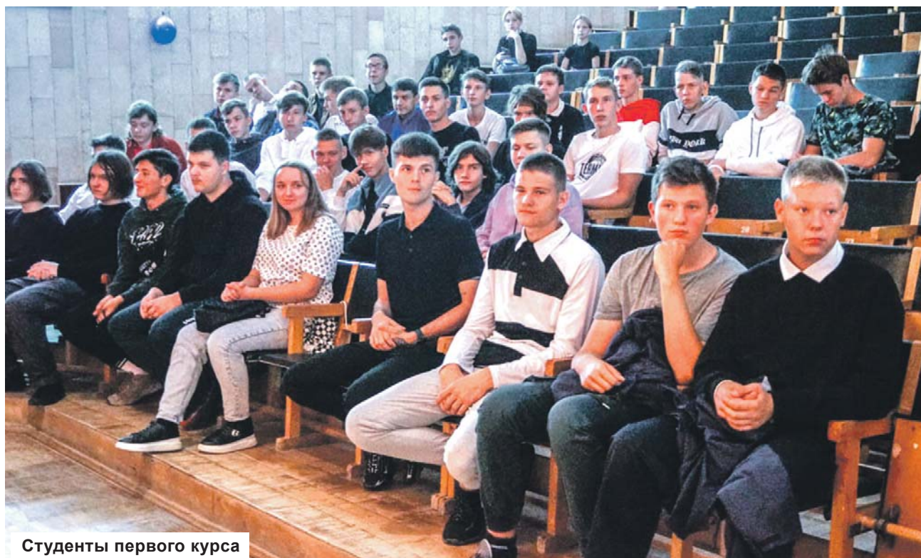
Студенты первого курса