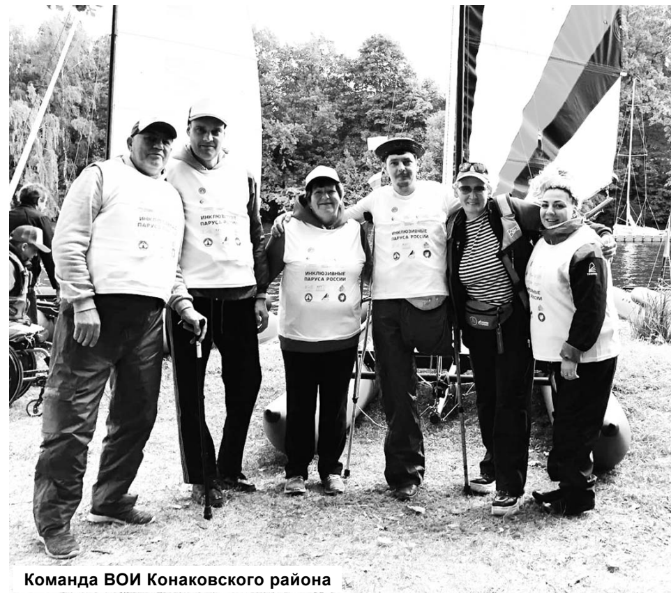
Команда ВОИ Конаковского района