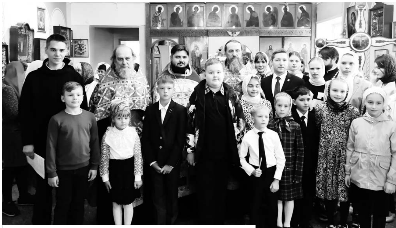
Священнослужители с воспитанниками ДЮЦ "Новая Корчева"