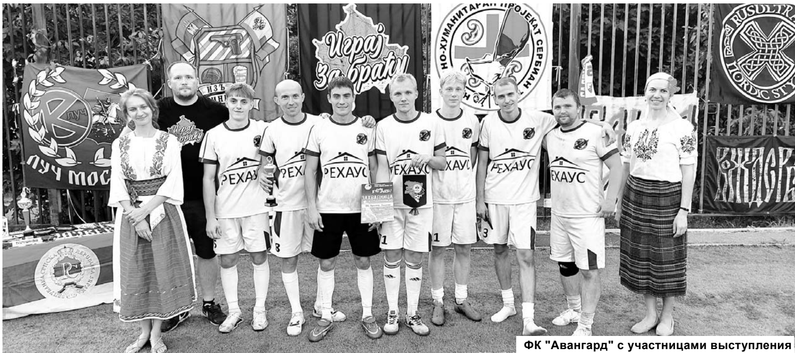
ФК "Авангард" с участницами выступления