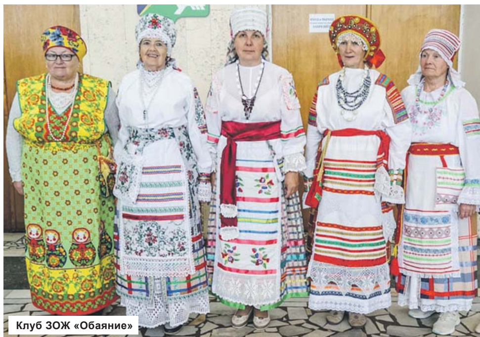
Клуб ЗОЖ «Обаяние»