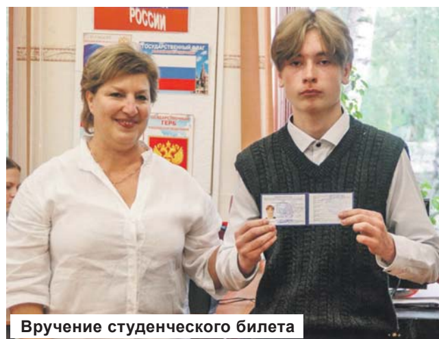
Вручение студенческого билета

31 августа для первокурсников распахнулись двери Конаковского Энергетического Колледжа и прозвучал первый звонок. В честь начала учебного года в актовом зале прошла торжественная церемония.