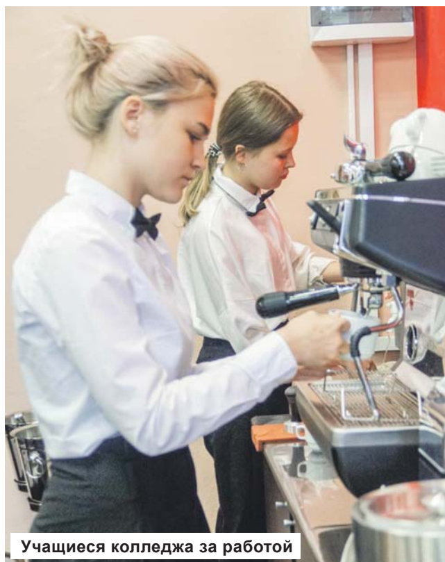
Учащиеся колледжа за работой

Начало на 1-й стр. Благодаря Правительству Тверской области и министерству Промышленности и Торговли Тверской области наш колледж получил грант для осна-