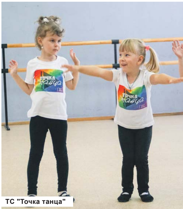
ТС «Точка танца»