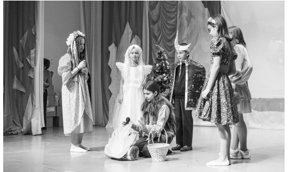
Рождественский концерт в селе Дмитрова Гора