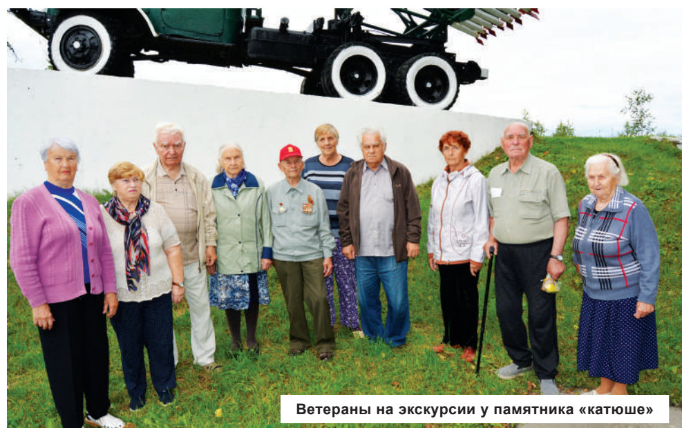
Ветераны на экскурсии у памятника «катюше»