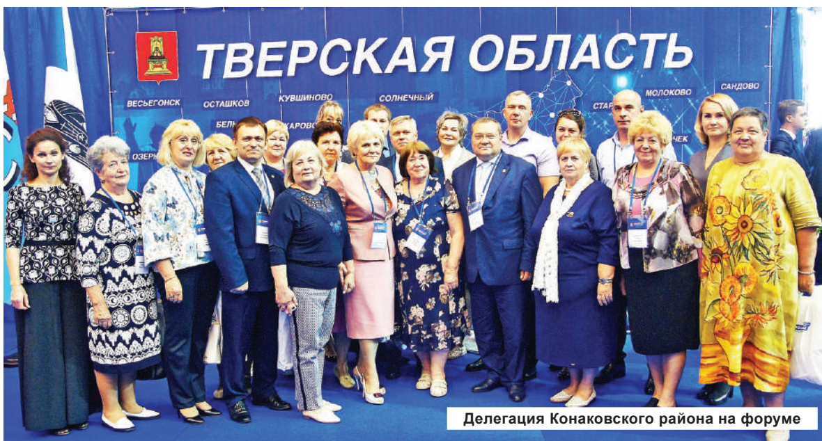
Делегация Конаковского района на форуме

21 августа в столице региона прошел ежегодный форум муниципальных образований Тверской области «Верхневолжье-2019 – территория развития». В его работе приняла участие и делегация Конаковского района.