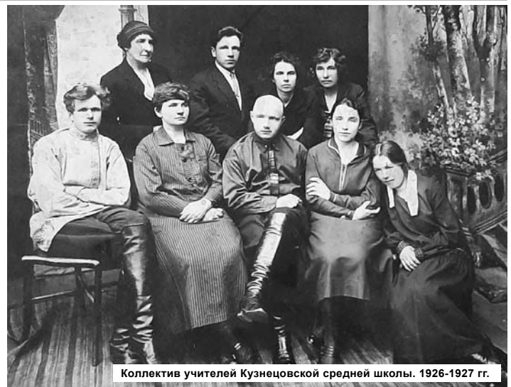
Коллектив учителей Кузнецовской средней школы. 1926-1927 гг.

В начале 50-х переехал в Великие Луки. Тогда город как раз отделился от Калининской области, сформировал отдельную – Великолукскую. Как раз в то время папу направили туда работать заместителем заведующего областным отделом на-