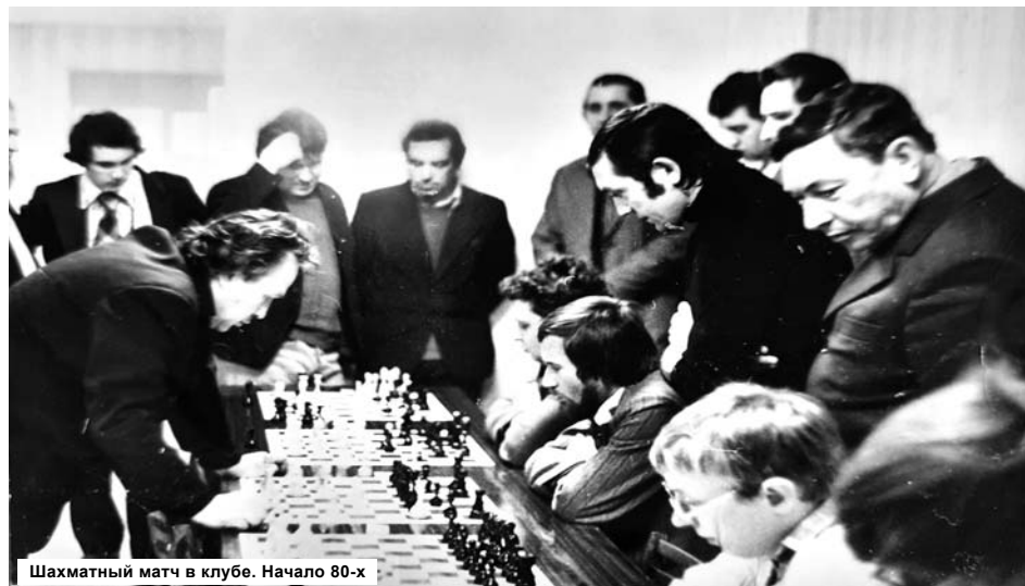
Шахматный матч в клубе. Начало 80-х