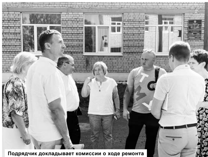
Подрядчик докладывает комиссии о ходе ремонта

В этом году школа поселка Первое мая за короткий период летних каникул серьезно преобразилась - здесь заканчивается капитальный ремонт (утепление) кровли, капитальный ремонт (утепление) фасада, подрядчики практически завершили установку 83 пластиковых оконных блоков. Стоимость работ - более 15 миллионов рублей, источник финансирования - бюджет Конаковского района. В школе работают две подрядные организации. Одни утепляют фасад и кровлю, другие меняют окна. От качества работ каждого подрядчика