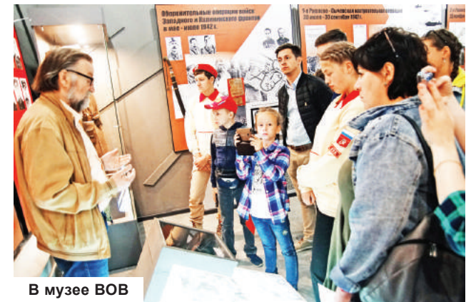
В музее ВОВ

ков, ознакомиться с письмами с фронта, с рассказами очевидцев, фотографиями. Говоря о погибших, нельзя не вспомнить нашего Президента Владимира Путина, который принимал участие в открытии мемориала вместе с Президентом Республики Беларусь Александром Лукашенко. Он озвучил число погибших в Ржевской битве советских солдат: 1 миллион 154 тысячи 698 человек, которых потеряла Красная армия с октября 1941 по март 1943 года, включая раненых и пропавших без вести. На гранитных стенах мемориала высотой 6 метров высечены имена более 17 тысяч погибших в боях на Ржевско-Вяземском выступе. От обилия фамилий рябит в глазах, а ведь это - всего лишь полтора процента от числа погибших в районе Ржева. Очень явственно осознаешь - какой ценой досталась нам победа. Ржевская битва считается самой кровопролит-