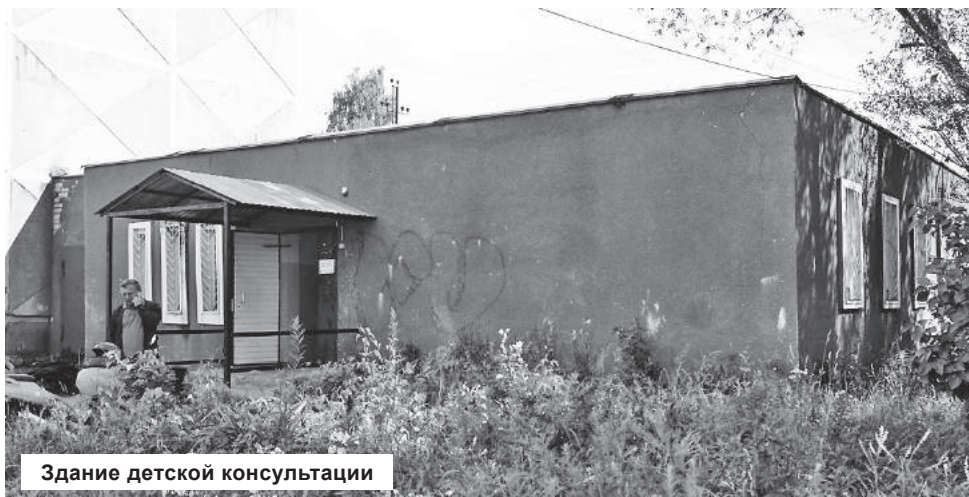
Здание детской консультации