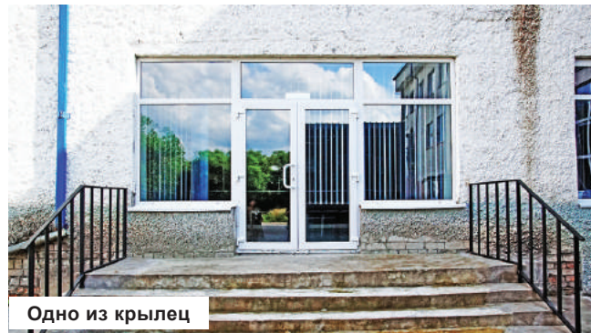
Одно из крылец