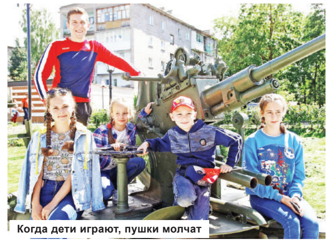
Когда дети играют, пушки молчат