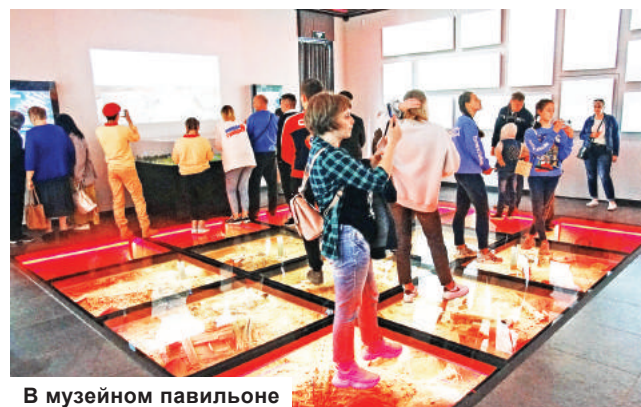
В музейном павильоне

ков, ознакомиться с письмами с фронта, с рассказами очевидцев, фотографиями. Говоря о погибших, нельзя не вспомнить нашего Президента Владимира Путина, который принимал участие в открытии мемориала вместе с Президентом Республики Беларусь Александром Лукашенко. Он озвучил число погибших в Ржевской битве советских солдат: 1 миллион 154 тысячи 698 человек, которых потеряла Красная армия с октября 1941 по март 1943 года, включая раненых и пропавших без вести. На гранитных стенах мемориала высотой 6 метров высечены имена более 17 тысяч погибших в боях на Ржевско-Вяземском выступе. От обилия фамилий рябит в глазах, а ведь это - всего лишь полтора процента от числа погибших в районе Ржева. Очень явственно осознаешь - какой ценой досталась нам победа. Ржевская битва считается самой кровопролит-