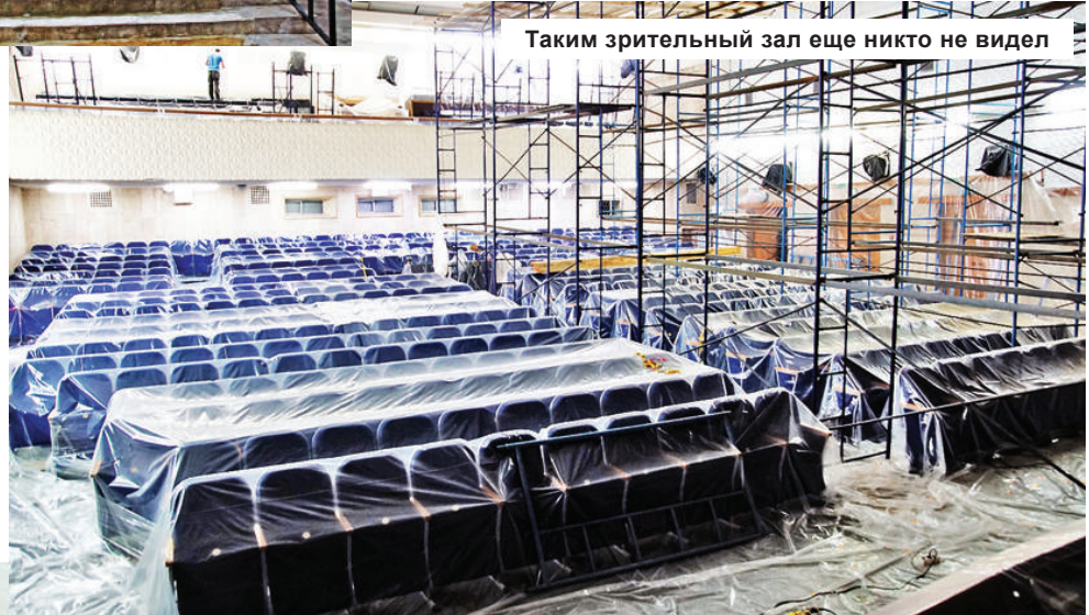
Таким зрительный зал еще никто не видел

- Спасибо, мы старались. Нестандартная ситуация, в которой мы все оказались, требовала нестандартных решений, а опыта работы в таких условиях ни у кого не было. И мы, конечно же, учились друг у друга, наблюдая в Сети за действиями своих коллег, например, ДК «Пролетарка», «Химволокно». А когда к середине апреля стало ясно, что мы не сможем провести в ДК празднование 75-летия Победы, к работе по подготовке онлайн-проектов в честь этой знаменатель-