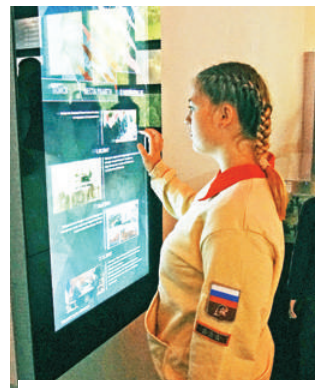
У интерактивной панели

В музее, который посетили конаковские волонтеры и молодоговардейцы, поражает стеклянный пол, через который можно увидеть оружие, каски, осколки, гильзы и снаряды — все атрибуты, найденные поисковиками на местах боев. На мультимедийных интерактивных панелях (что-то вроде «Книги памяти»), любой желающий может найти по имени и фамилии погибших в боях солдат, даже своих родственни-