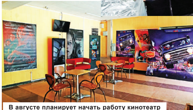
В августе планирует начать работу кинотеатр

- Спасибо, мы старались. Нестандартная ситуация, в которой мы все оказались, требовала нестандартных решений, а опыта работы в таких условиях ни у кого не было. И мы, конечно же, учились друг у друга, наблюдая в Сети за действиями своих коллег, например, ДК «Пролетарка», «Химволокно». А когда к середине апреля стало ясно, что мы не сможем провести в ДК празднование 75-летия Победы, к работе по подготовке онлайн-проектов в честь этой знаменатель-