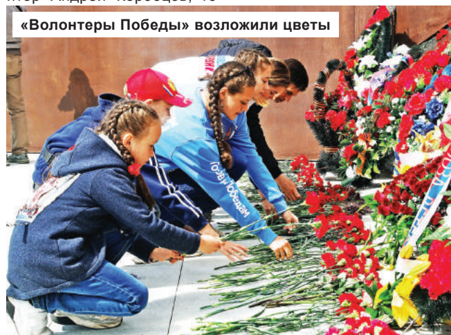
«Волонтеры Победы» возложили цветы