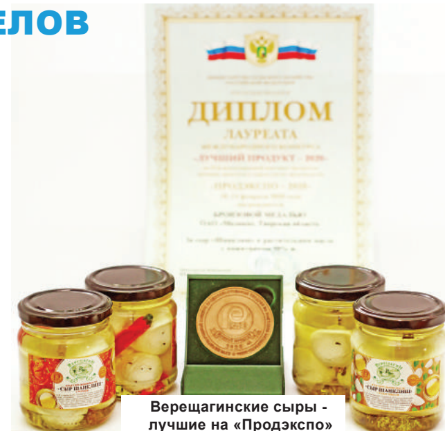
Верещагинские сыры - лучшие на «Продэкспо»