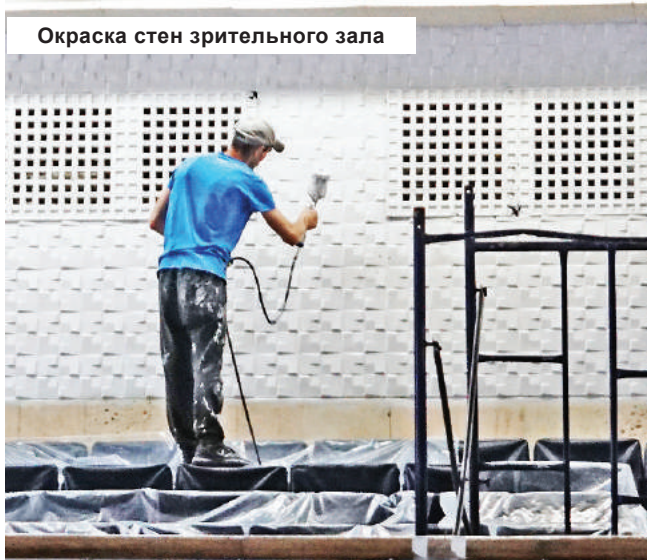
Окраска стен зрительного зала

- На самом деле, о внедрении информационных технологий говорилась уже давно, этому посвящен федеральный проект «Цифровая культура», нацеленный на расширение применения и повышение эффективности использования IT в культуре. И то, что ещё полгода назад было размытым, «желательным, но не обязательным», в период самоизоляции стало необходимым, чуть ли не единственным способом общения. А нарабатанный прежде багаж оказался хорошим подспорьем: группы «Современника» в соцсетях стали основной площадкой проведения наших мероприятий, число подписчиков в них превысило две тысячи человек, самые популярные ролики набирают тысячи просмо-