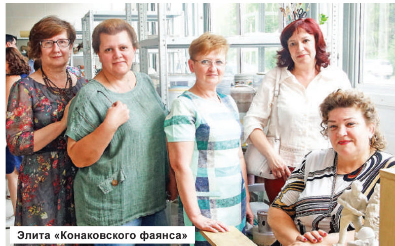
Элита «Конаковского фаянса»