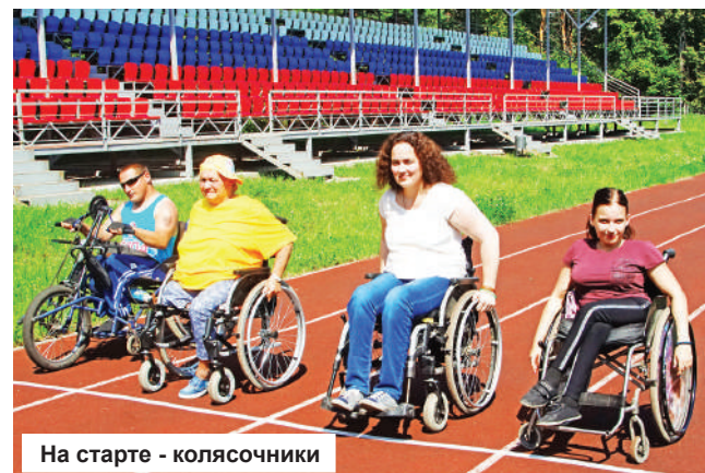
На старте - колясочники

В программе фестиваля были забеги на сто метров, броски баскетбольного мяча в кольцо, дартс, арм- и м-рестлинг, шашки по олимпийской системе, метание мяча на дальность, зрелищные гонки на инвалидных колясках и не менее зрелищное фигурное вождение колясок (впервые за историю этого фестиваля). Кульминацией