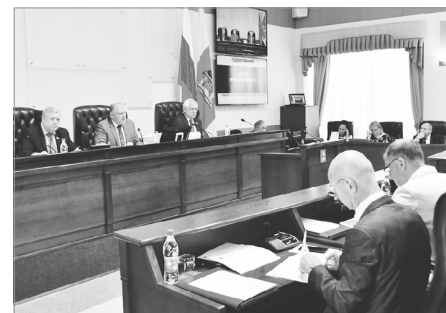
На пленарном заседании Законодательного Собрания Тверской области

Согласно предложенным в закон изменениям, в 2022 году предусматривается увеличение доходов областного бюджета на 6 млрд 879 млн руб., а расходной части – на 4 млрд руб.