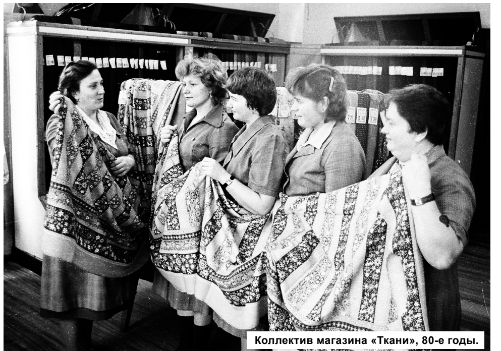
Коллектив магазина «Ткани», 80-е годы.