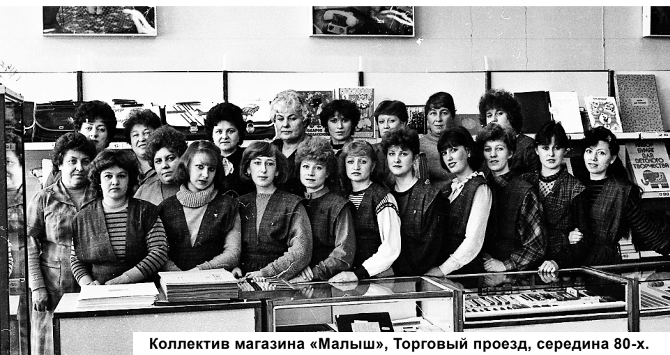
Коллектив магазина «Малыш», Торговый проезд, середина 80-х.