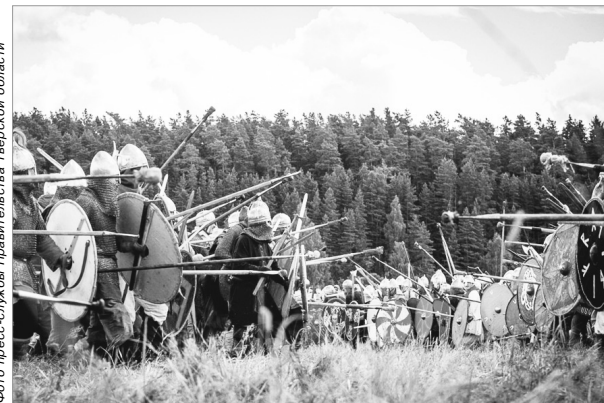
Сражение дружин на «Былинном берегу»

С подробной информацией можно ознакомиться на сайте фестиваля исторической реконструкции «Былинный берег» по ссылке: http://10vek.ru/by-stander.html .