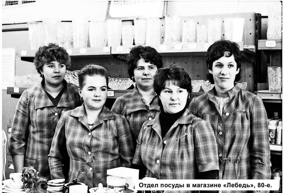
Отдел посуды в магазине «Лебедь», 80-е.