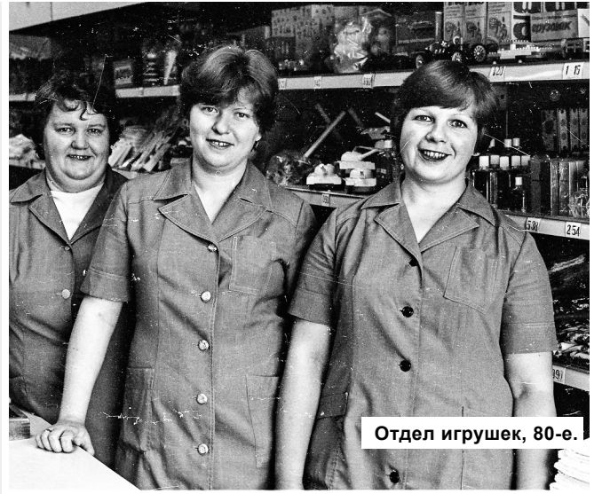
Отдел игрушек, 80-е.

Так получилось, что день рождения нашего проекта совпал с профессиональным праздником – Днем работников торговли. А, поскольку, свои публикации в «Заре» наш проект всегда старался приурочить к каким-то датам, то вот вам подборка из фотографий 80-х годов, на которых изображены конаковские продавцы. Давайте вспомним в этот день советскую торговлю. Ведь она очень отличалась от нынешней. Была в ней своя прелесть. Поностальгируем?