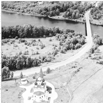
Дорога к храму, Зубцовский район

– началу Вазузского водохранилища. Здесь проходит туристический маршрут к храму Знамени Божией Матери