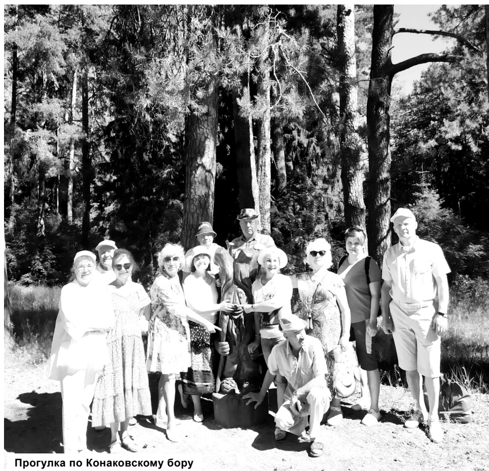
Прогулка по Конаковскому бору