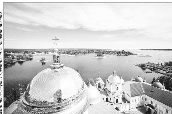
Вид с колокольни монастыря «Нилова пустынь»

В рамках программы дорожных работ 2022 года ремонт продолжается на других дорогах второго класса: «Москва – Санкт-Петербург» – Большие Борки – Нестерово – Черничено, Ржев – Сухуша, Бежецк – Поречье, Титово – Белый Городок – Приволжский, Малыгино – Щекотово, Торжок – Раменье, Сонково – Кой, Спиново – Козлово – Ососье, «Сергиев Посад – Калязин – Рыбинск – Черповец» – Спасское, Дмитрова Гора – Федоровское, Березники – Хмелевка.